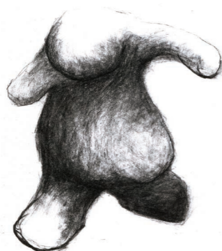
QUESTO CHE STAI FACENDO MI FA' MALE