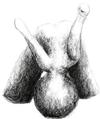
ZABIJANJE GLAVE U POD