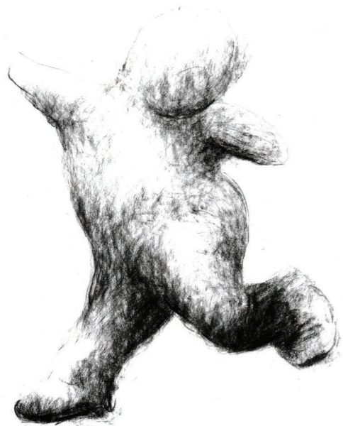
HAPPY GO LUCKY