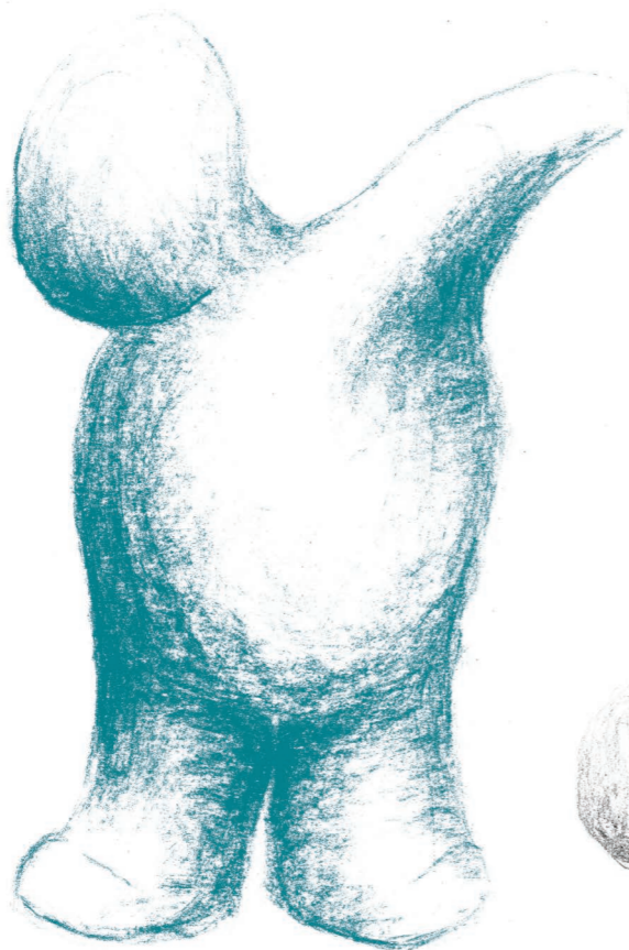
BOH! LASCIA STARE