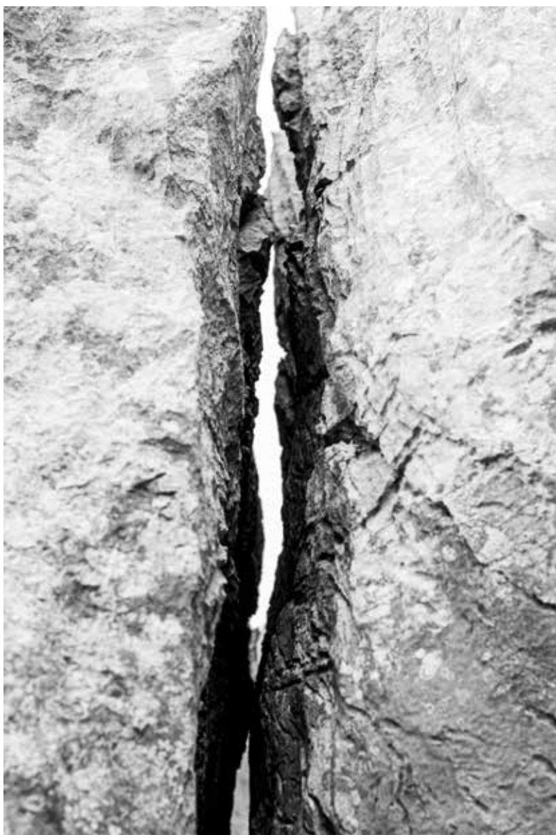
Dodiri , 2024., crno-bijela fotografija, 50 × 70 cm