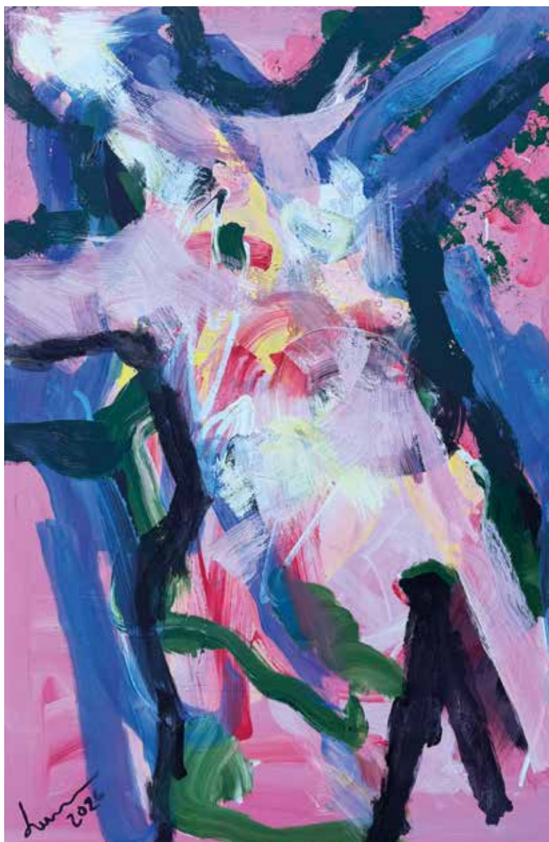
Radost življenja II, 2026., akril na platnu, 120 x 80 cm