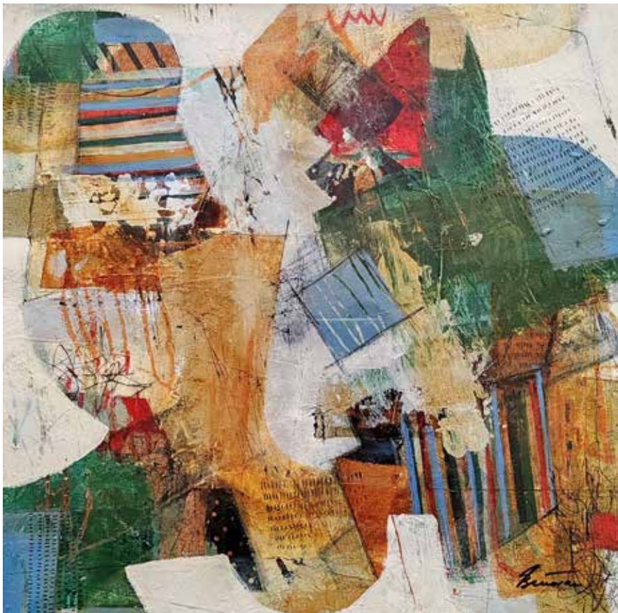
Imam nešto za tebe, 2025., 30x30 cm, kombinirana tehnika na 300 gr papiru