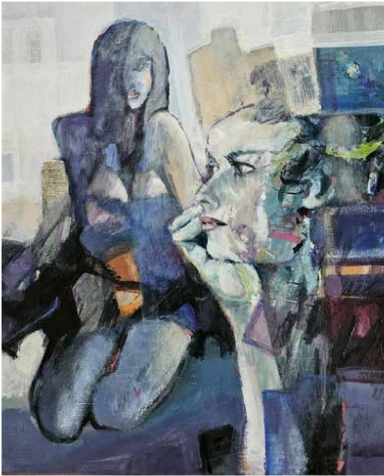
Njena imitacija , 2024., akril na platnu, 59,5 × 49,5 cm