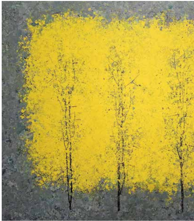
Yellow Tree, 2013., kombinirana tehnika, 100 × 120 cm