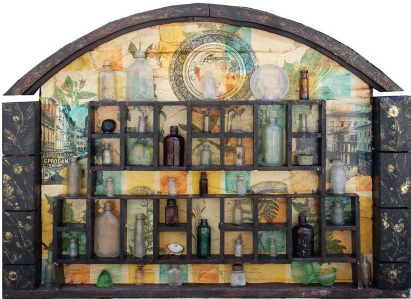
Branko Lenić , Ljekarna Prodam, 2007., assemblage Apotheke Prodam, 2007, Assemblage