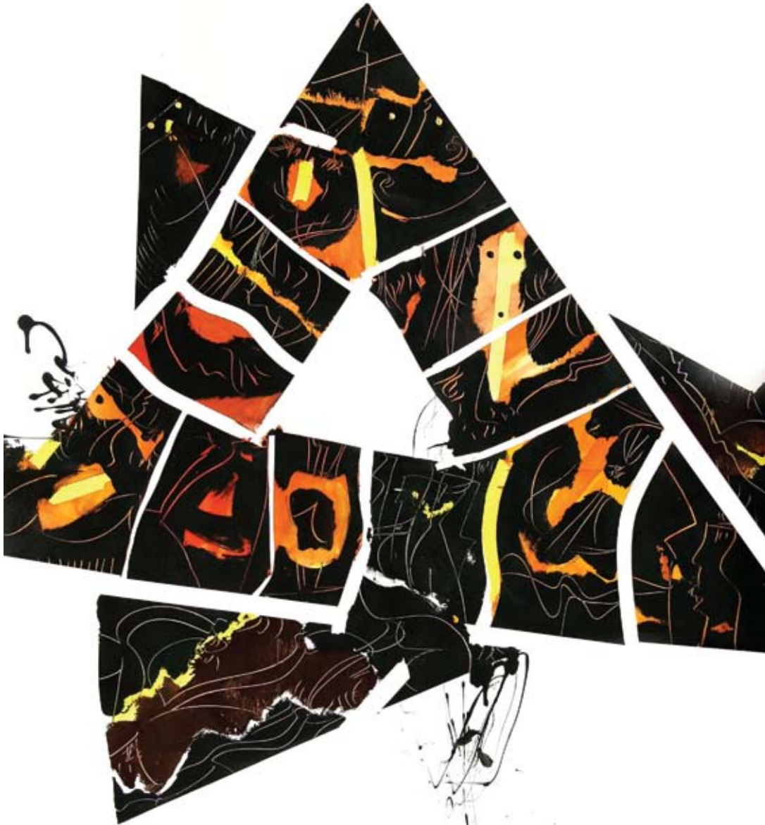
Ivan Balažević,, "Todos artista desesperados", 100 x 140 cm, papir/Papier