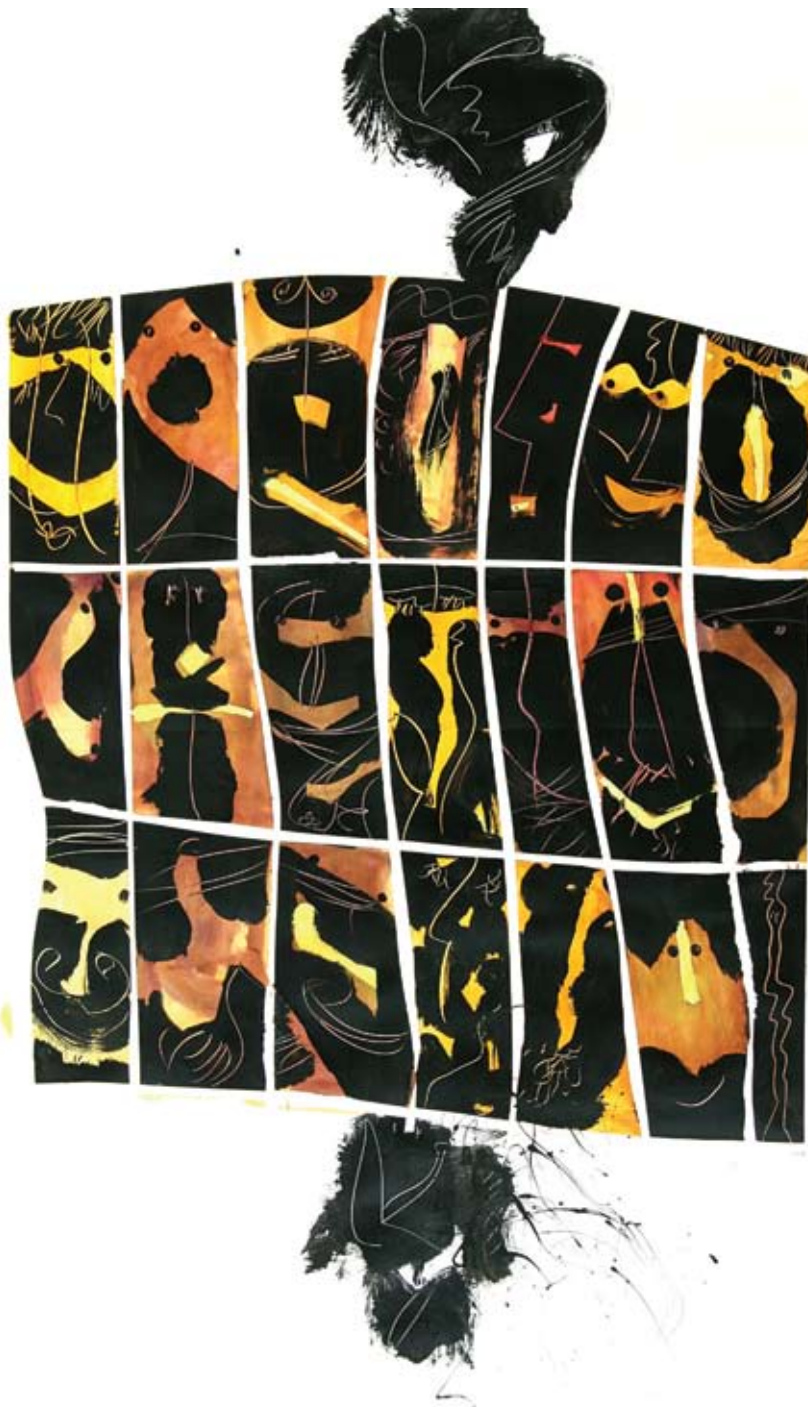
Ivan Balažević, „Todos artista desperados”, 100 x 140 cm, papir/Papier