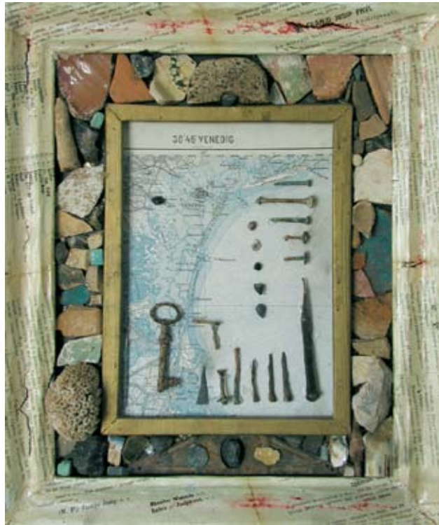
Branko Lenić , Venecijanske priče , assemblage, 2005 Venezianische Erzählungen, Assemblage, 2005