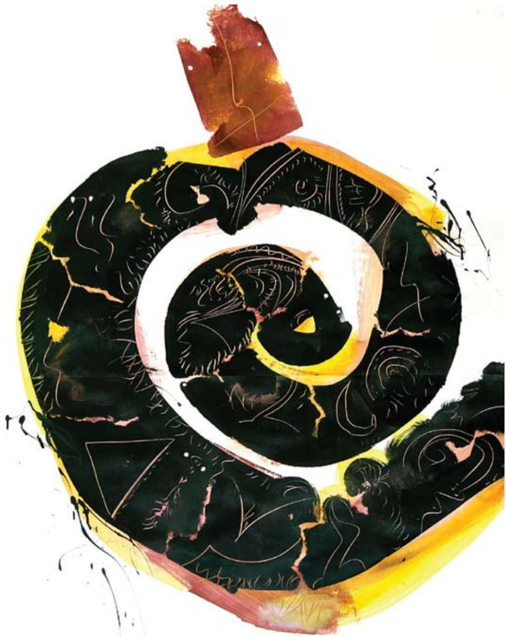
Ivan Balažević, "Todos artista desesperados", 100 x 140 cm, papir/Papier