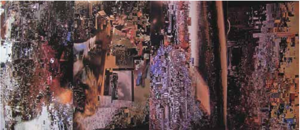
Ekosonder , kombinirana tehnika, 200 x 320 cm