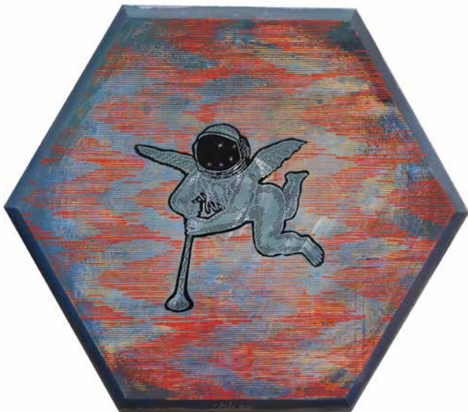
Angelusdrom A , 2016., kombinirana tehnika na platnu, 80 X 80 cm,