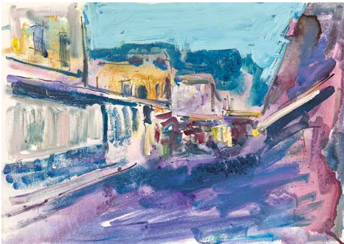
Riječka placa , 2025., akril na platnu, 50 x 70 cm