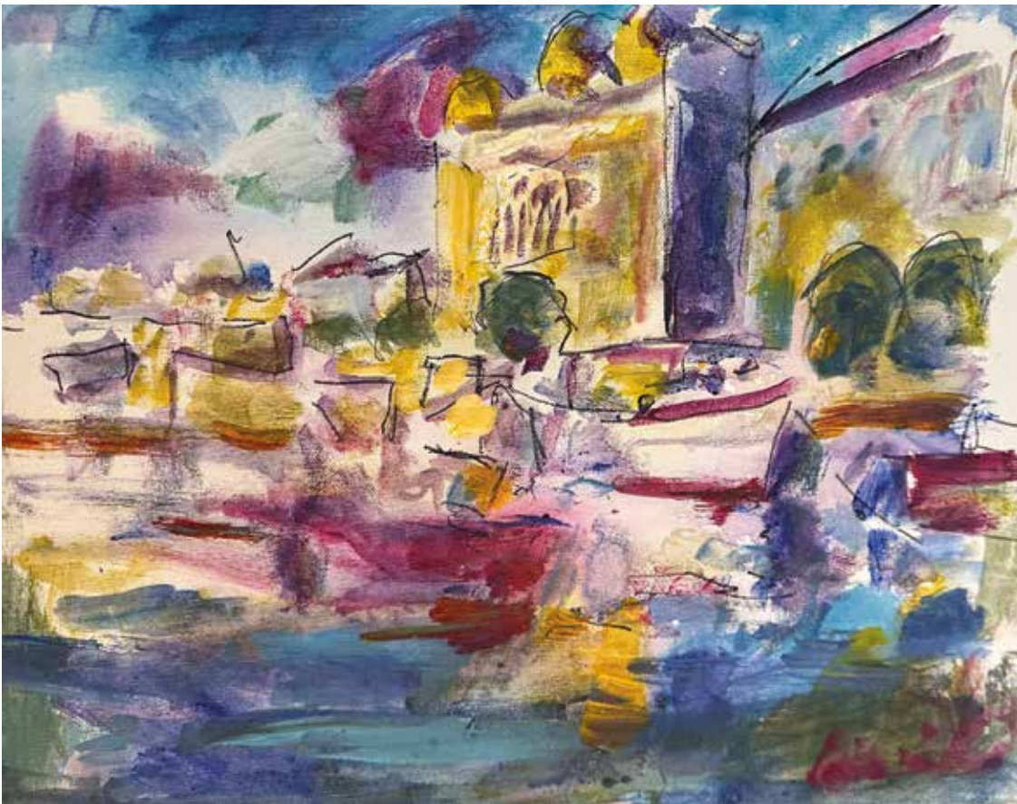
Riječka luka , 2025., akril na platnu, 50 x 70 cm