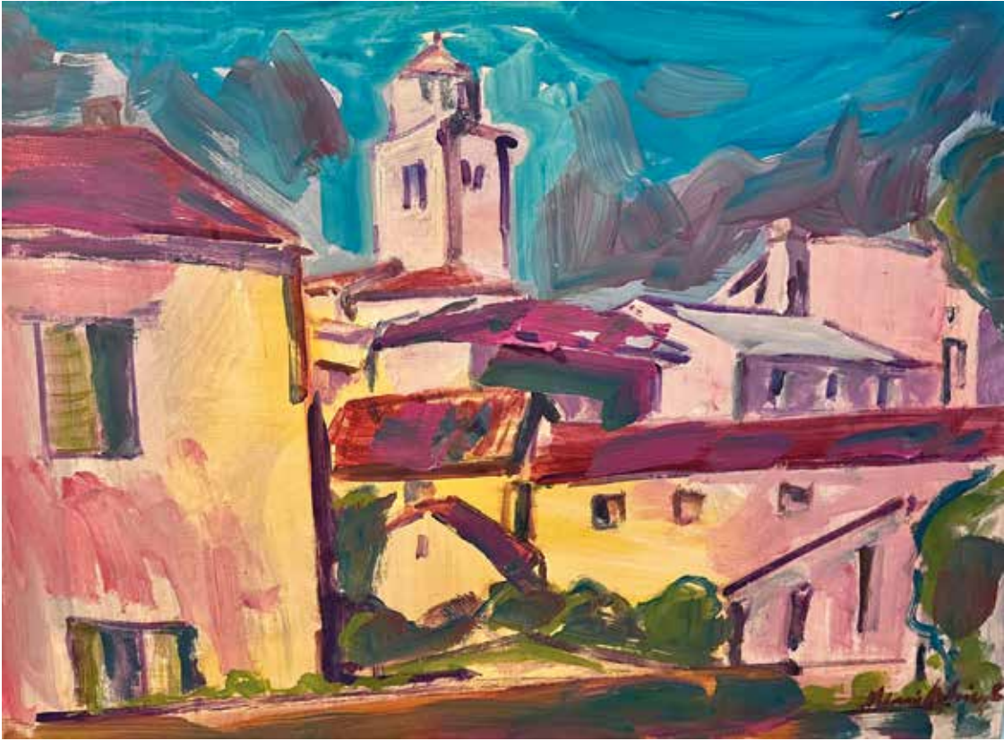
Kastav , 2025., akril na platnu, 60 x 80 cm