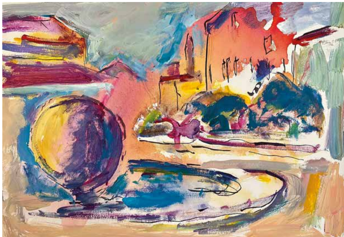
Rijeka, Džamonjina kugla, 2025., akril na platnu, 50 x 70 cm