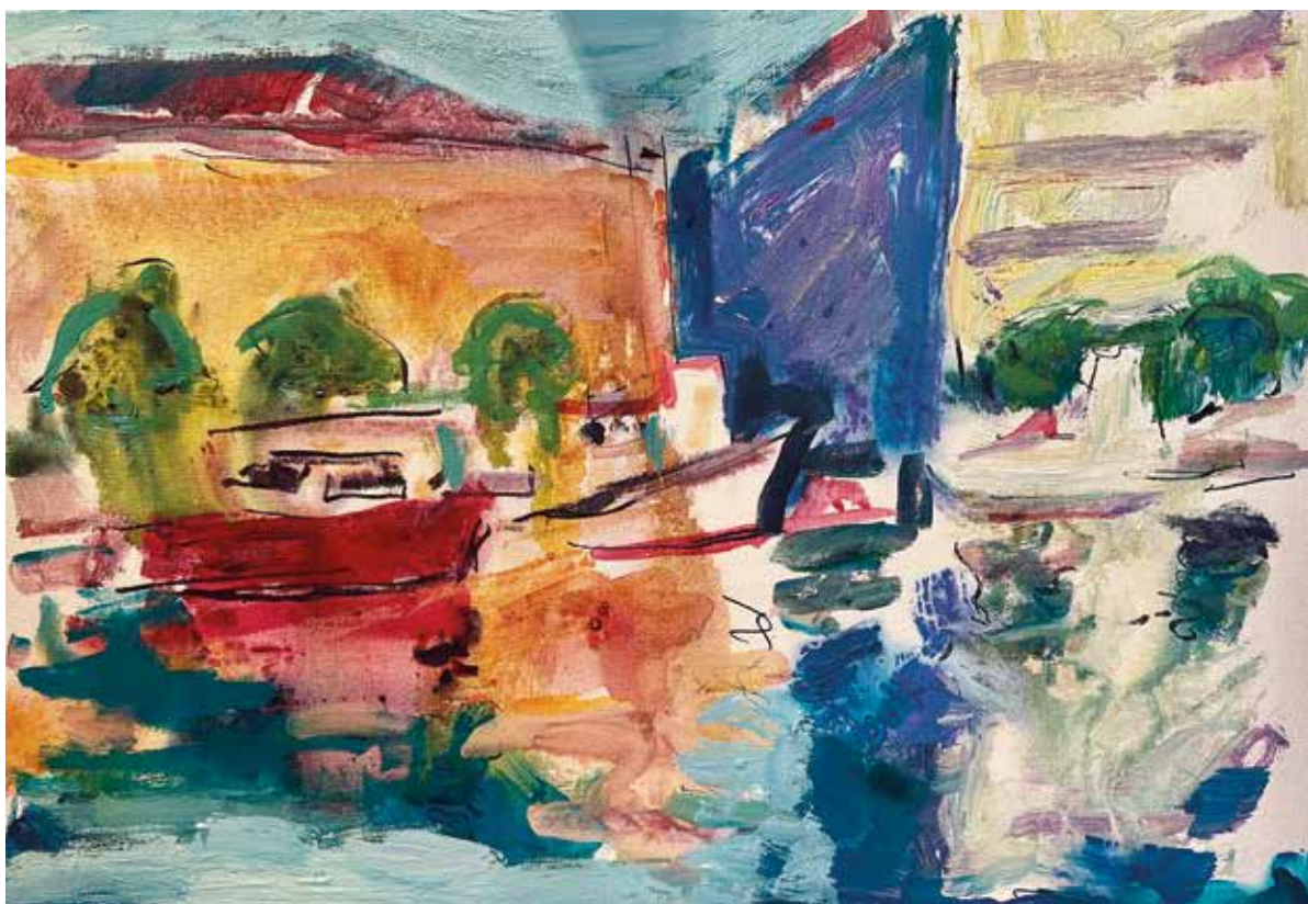
Riječka luka , 2025., akril na platnu, 40 x 50 cm