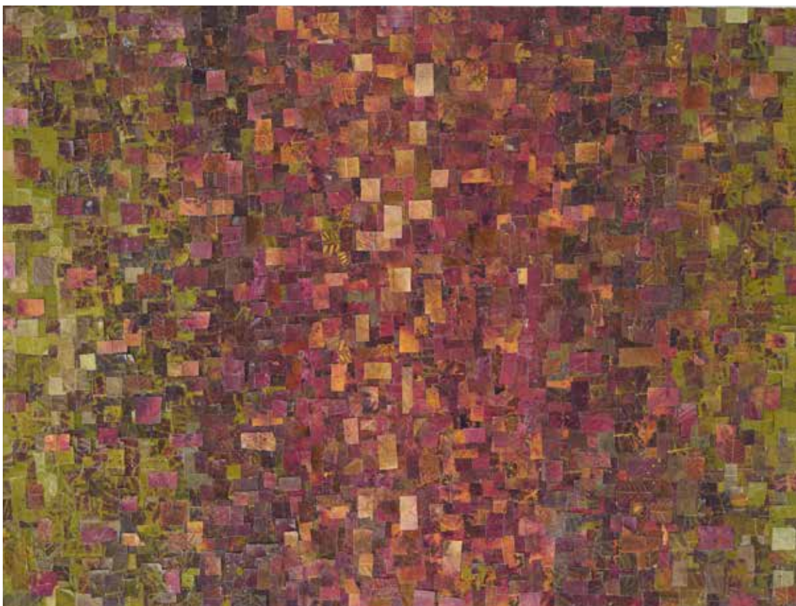
Kompozicija 5, kolaž, herbarijsko lišće, dim. 80x60, 2025.