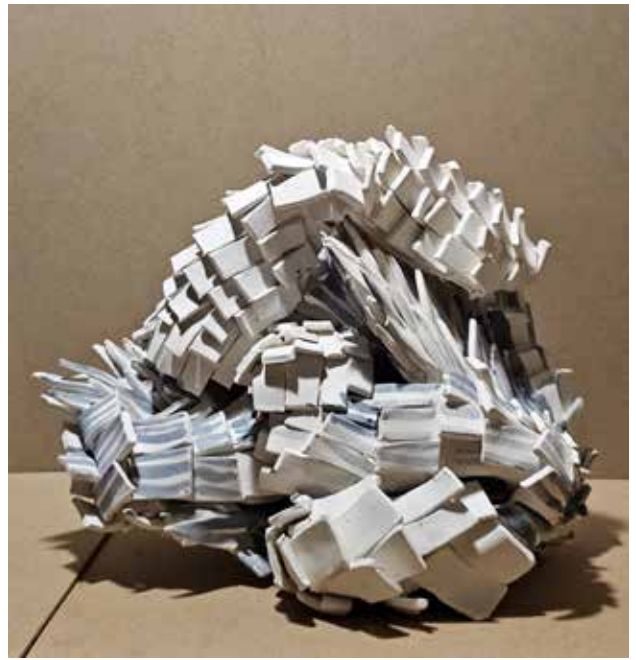
Biomorf , 2025.-2026., bijela glina, siva i crna engoba, transparentna glazura, visine 35 x 25 x 20 cm