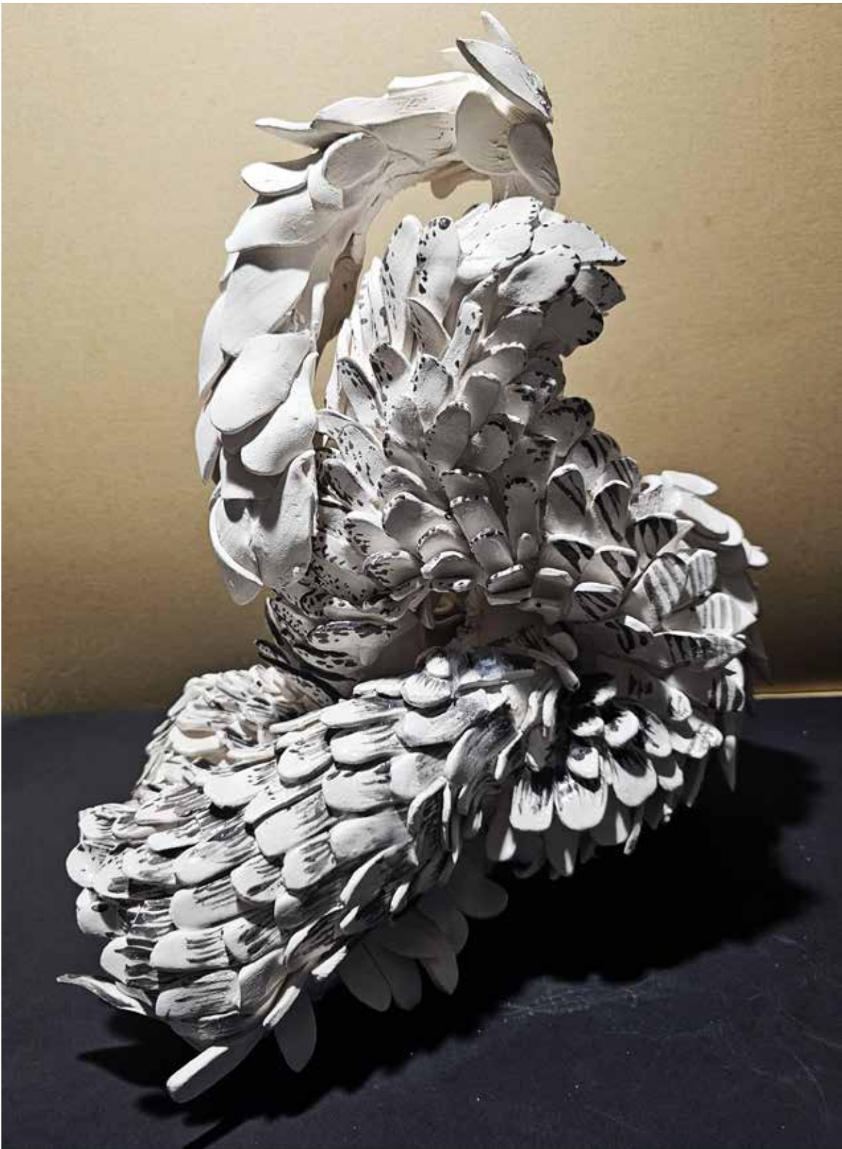
Biomorf , 2025.-2026., bijela glina, siva i crna engoba, transparentna glazura, visine 35 x 25 x 20 cm