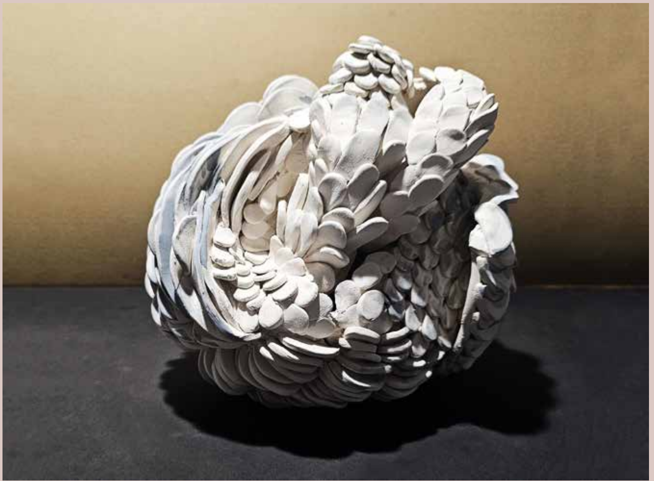
Biomorf , 2025.-2026., bijela glina, siva i crna engoba, transparentna glazura, visine 35 x 25 x 20 cm