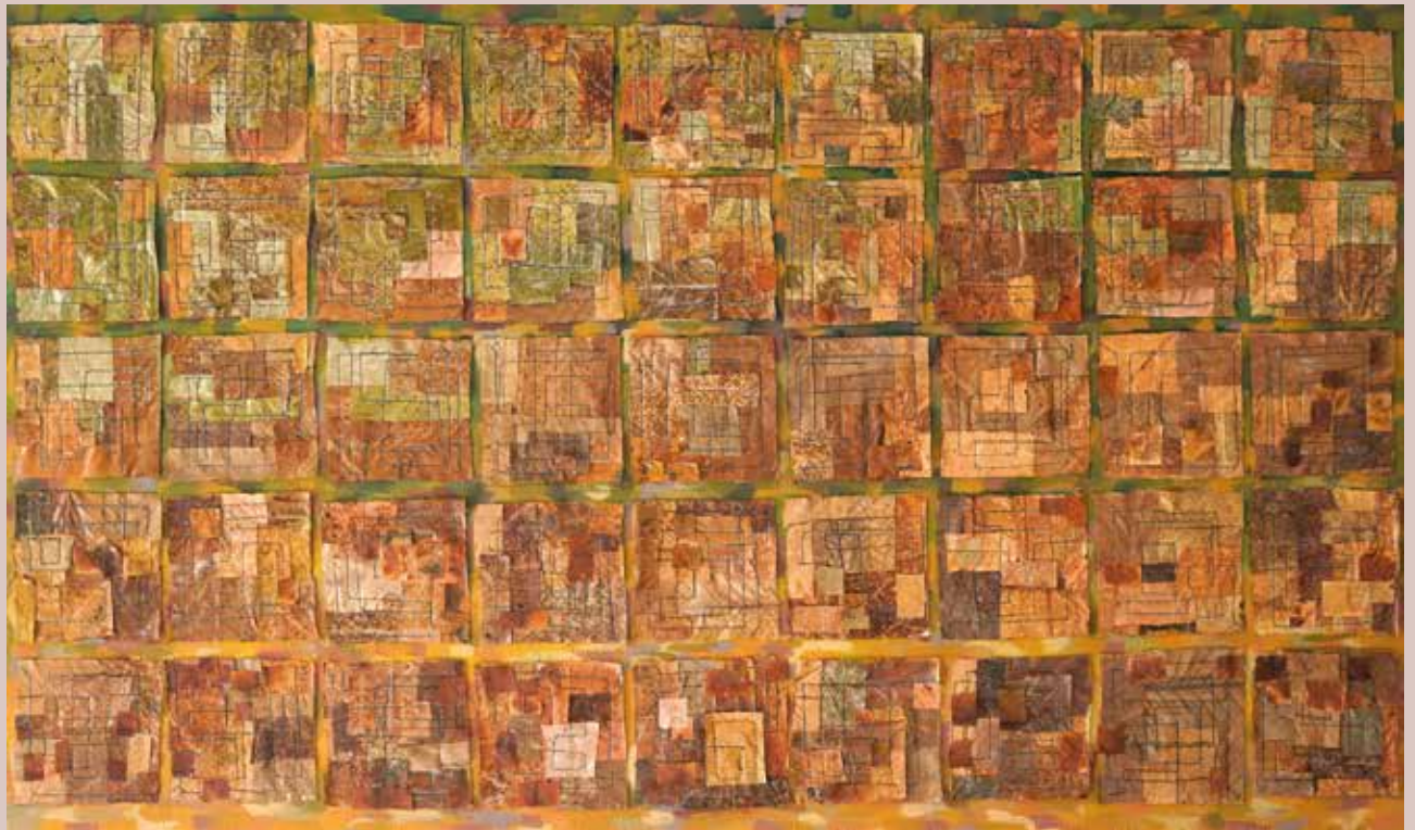
Kompozicija 3 , kolaž herbarijsko lišće, šivanje na žutici, akril, dim. 92x55, 2025.

Radno vrijeme: od 10 do 13 i od 17 do 20 sati, subotom od 10 do 13 sati, nedjeljom zatvoreno