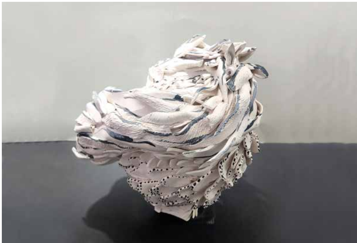
Biomorf , 2025.-2026., bijela glina, siva i crna engoba, transparentna glazura, visine 35 x 25 x 20 cm