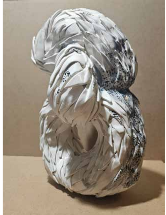
Biomorf , 2025.-2026., bijela glina, siva i crna engoba, transparentna glazura, visine 35 x 25 x 20 cm