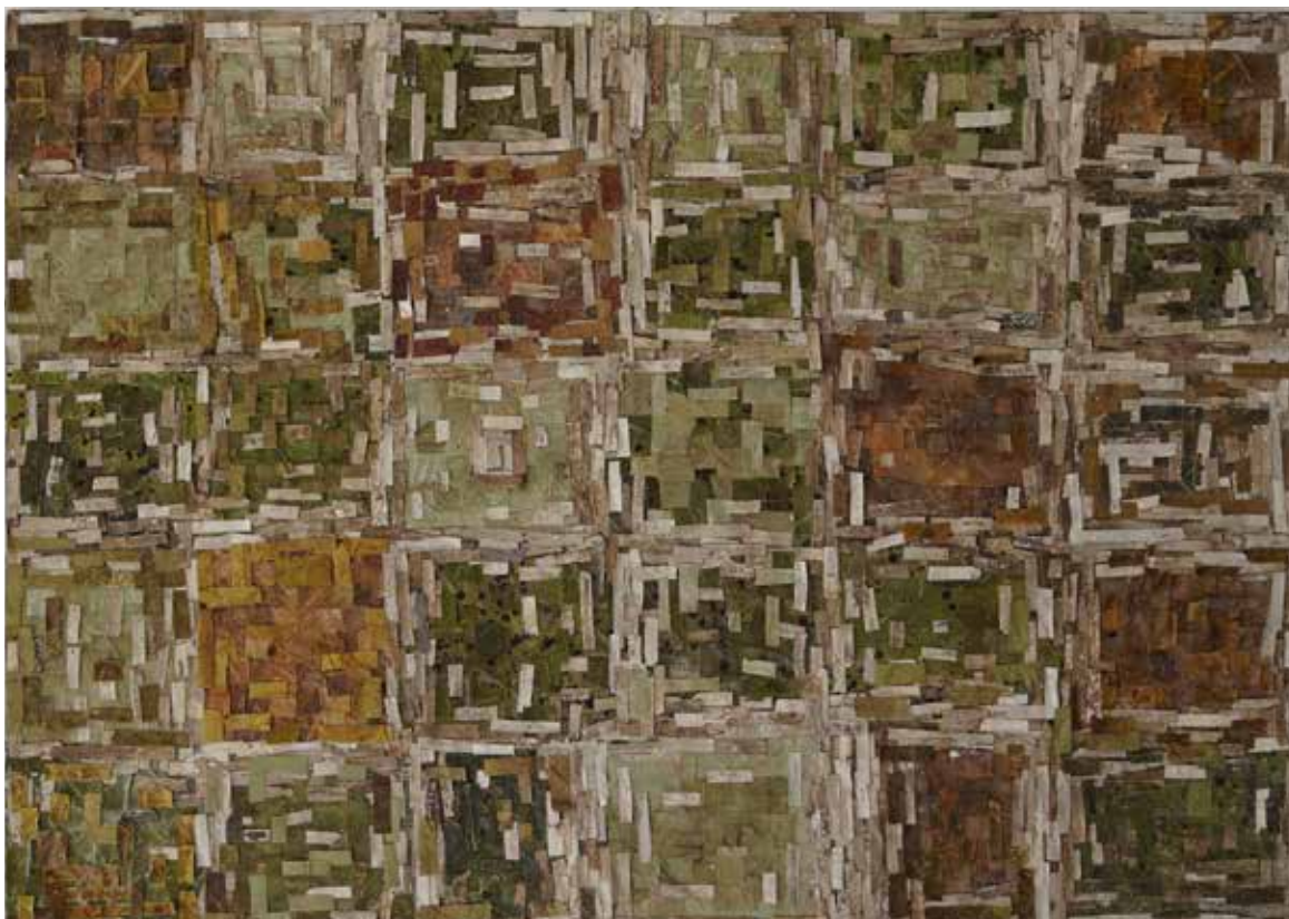
Kompozicija 4, kolaž, herbarijsko lišće, dim. 70x50, 2025.