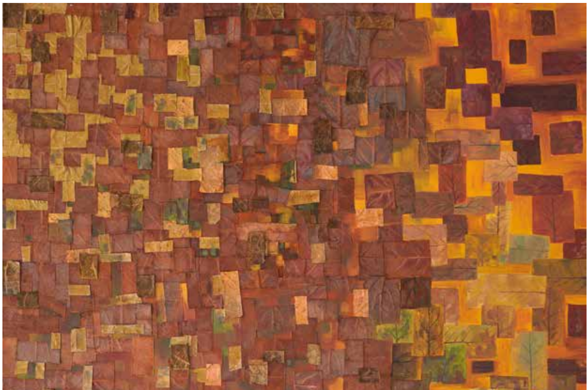
Kompozicija 2, kolaž, herbarijsko lišće, akril, 64x50, 2025.