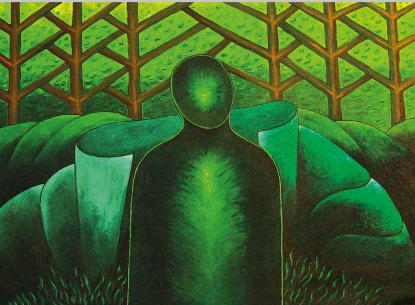
MOJE PRIRODNO STANJE , Akril na platnu, 100 x 145 cm, 2018.

HRVATSKO DRUŠTVO LIKOVNIH UMJETNIKA RIJEKA