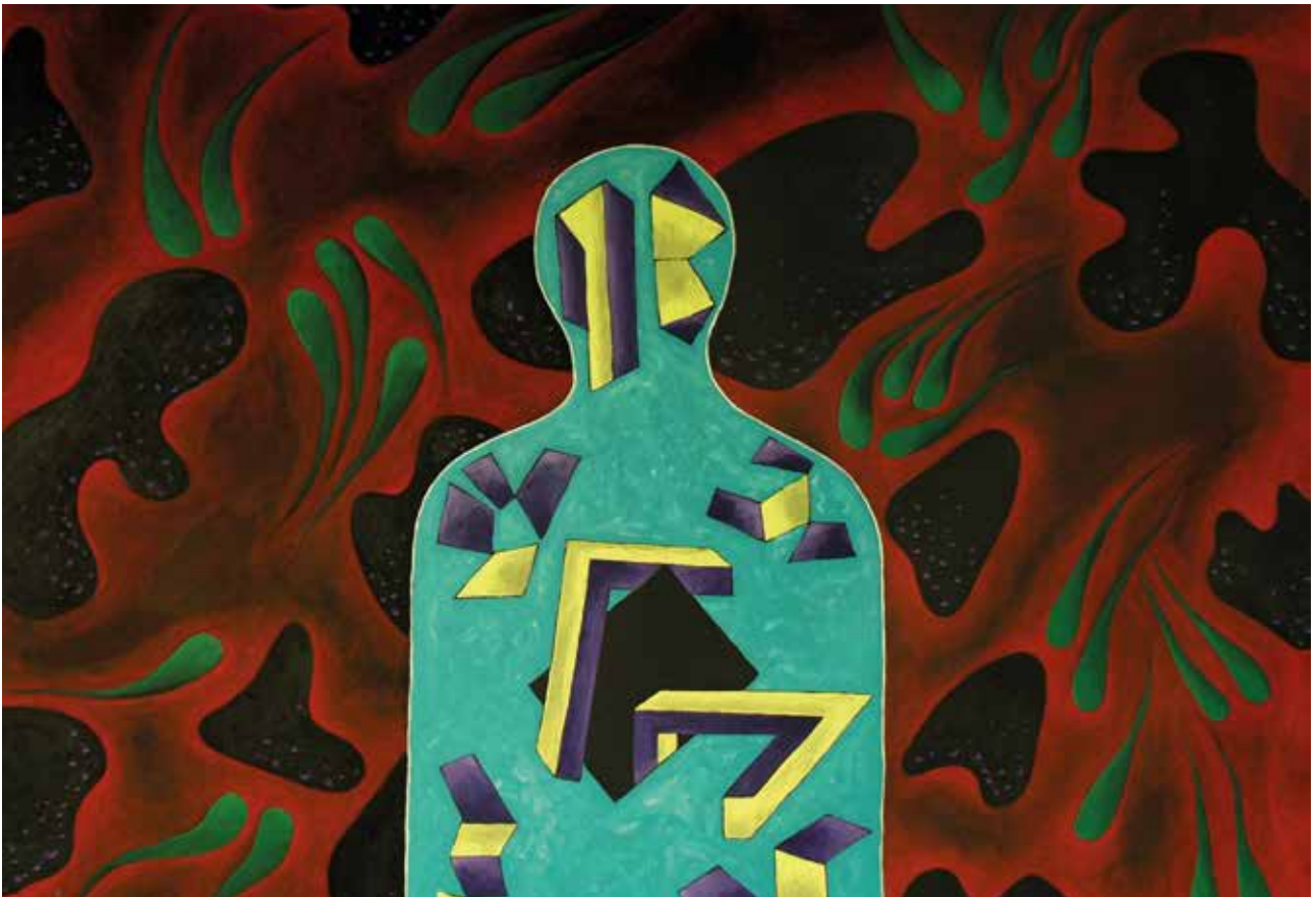
UZNEMIREN SAM, Akril na platnu, 100 x 145 cm, 2021.