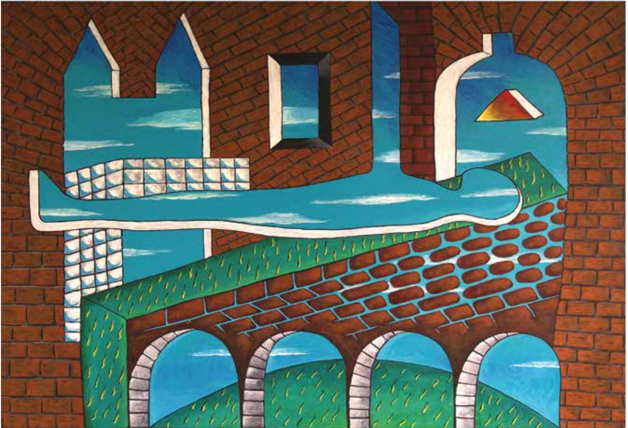
OSJEĆAM PRAZINU, Akril na platnu, 100 x 145 cm, 2021.