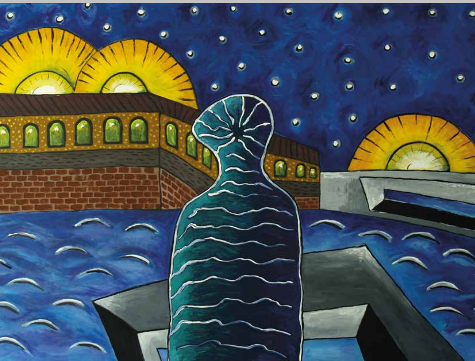
SJEĆAM SE , Akril na platnu, 100 x 145 cm, 2017.