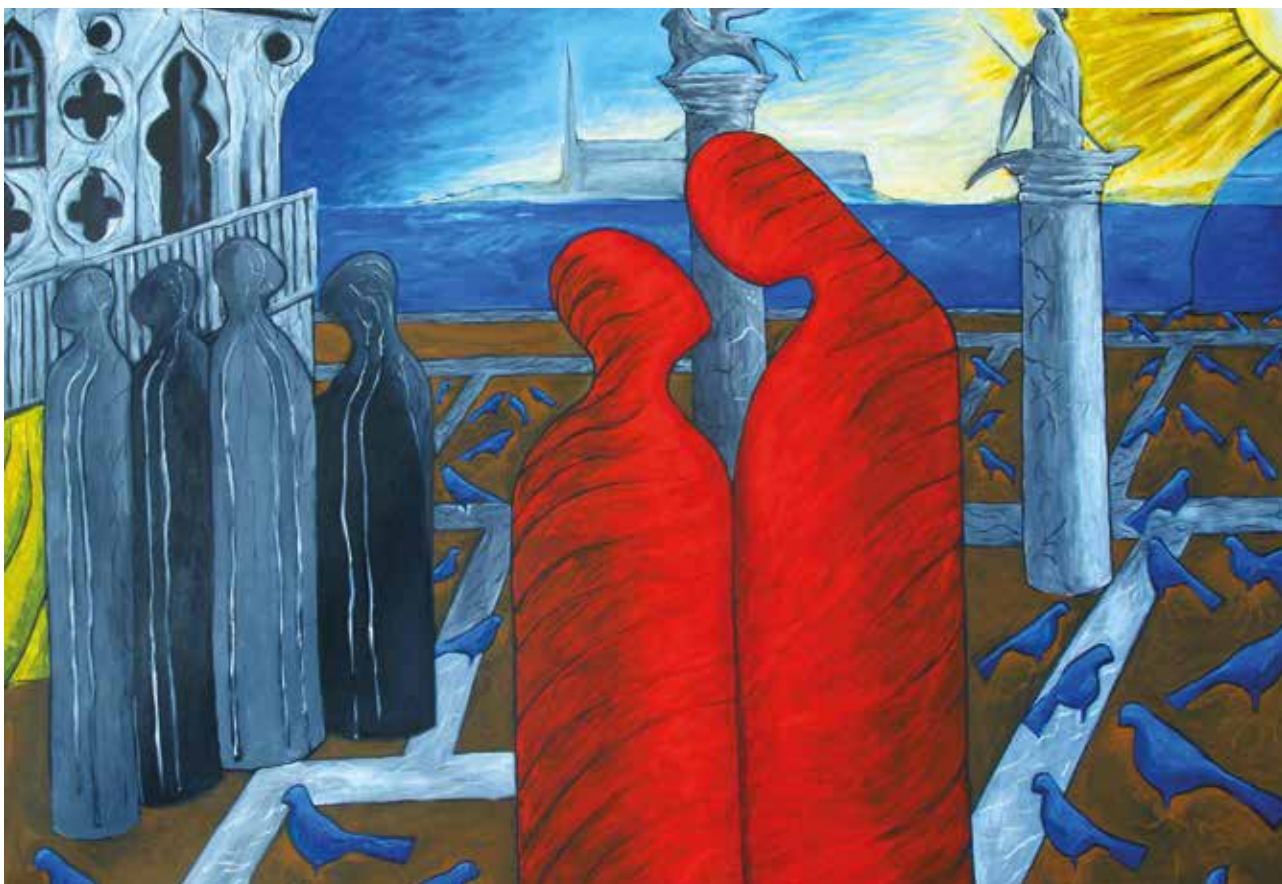
DOŽIVIO SAM NESTVARNO , Akril na platnu, 100 x 145 cm, 2018.

Branko Gulin (Kotor, 9. lipnja 1953.) Hrvatsko-američki umjetnik, kustos i pedagog. Tijekom karijere djelovao je u Hrvatskoj i Sjedinjenim Američkim Državama, gdje je radio u muzejskim institucijama, obrazovanju te na području skulpture i likovne umjetnosti. Njegov rad obuhvaća crtež, skulpturu, ready-made, performanse i multimedijalne projekte, s naglaskom na angažirani pristup i interdisciplinarnu umjetničku praksu.