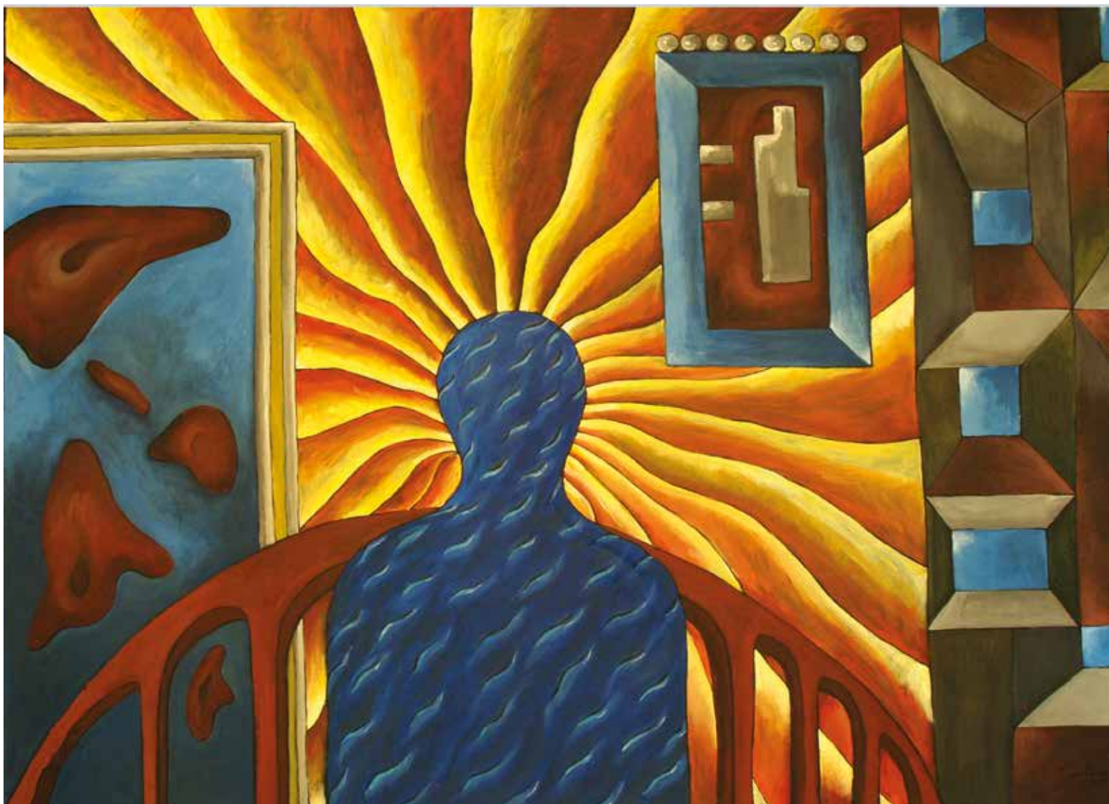
ŽELIM BUJNU SREĆU, Akril na platnu, 100 x 145 cm, 2017.