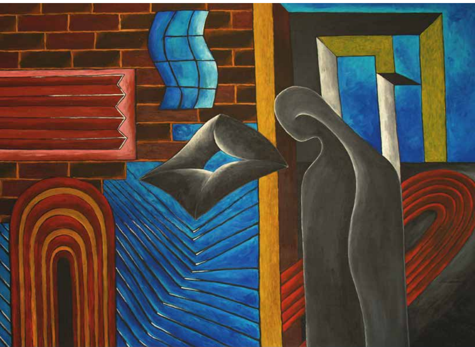
PITAM SE O SEBI , Akрил na planu, 100 x 145 cm, 2018.