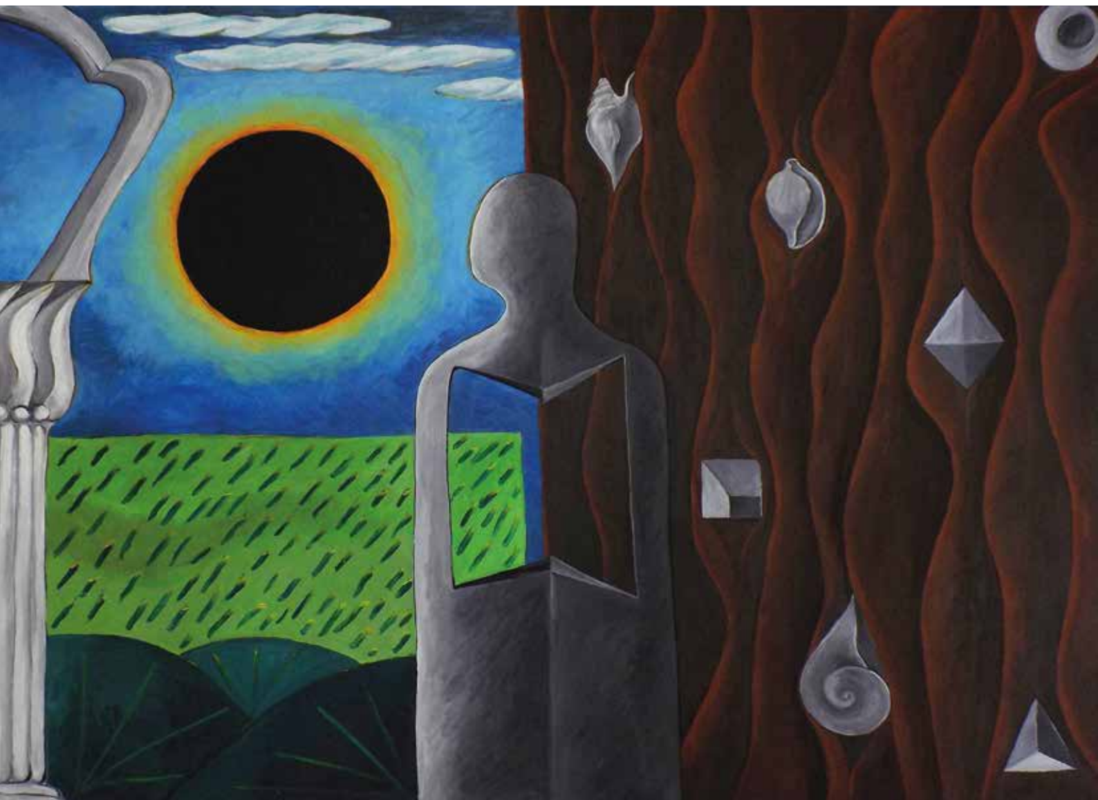
ČEZNEM ZA MEDITERANOM, Akrilik na platnu, 100 x 145 cm, 2017.