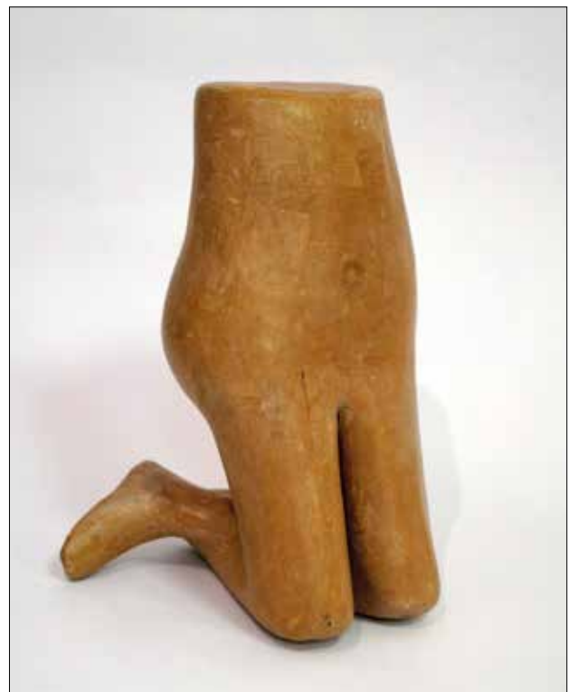
Djevojka (Savršena - nedovršena), 2017., kaširani papir, 15 x 12 x 26 cm