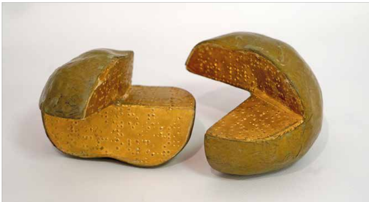
Brailleov rez, 2019. kaširani papir, 13 x 13 x 10 cm

Forma nastaje odražavajući realizam, oblikujući figure i reducirajući stvarnost. Izravan i neposredan pristup smišljenih i osebnih elemenata donosi meke zaobljene linije i slobodu masa, intenzivnih karakterera i prepoznatljivih atributa. U mjeri dlana slažu se slojevi na slojeve, list po list, oblikuju nabori i tvori volumen. Umjetnik ih predanim i svojstvenim pristupom mijenja i dorađuje, a oni izrastaju od veličine plodova jabuke do velikih i zavidnih figura u prirodnoj dimenziji čovjeka. Skulpture su ostavljene u bazičnom tonu papira, što pojačava dojam njihove jednostavnosti i minimalizma. Ta obična i svakodnevna pojavnost još više naglašava bit osobe koja je u središtu. U zlatnom ciklusu, noseći simboliku značenja ta boja se mijenja u zlatnu, kako bi se dalo na važnosti i ukazalo na stavove autora.