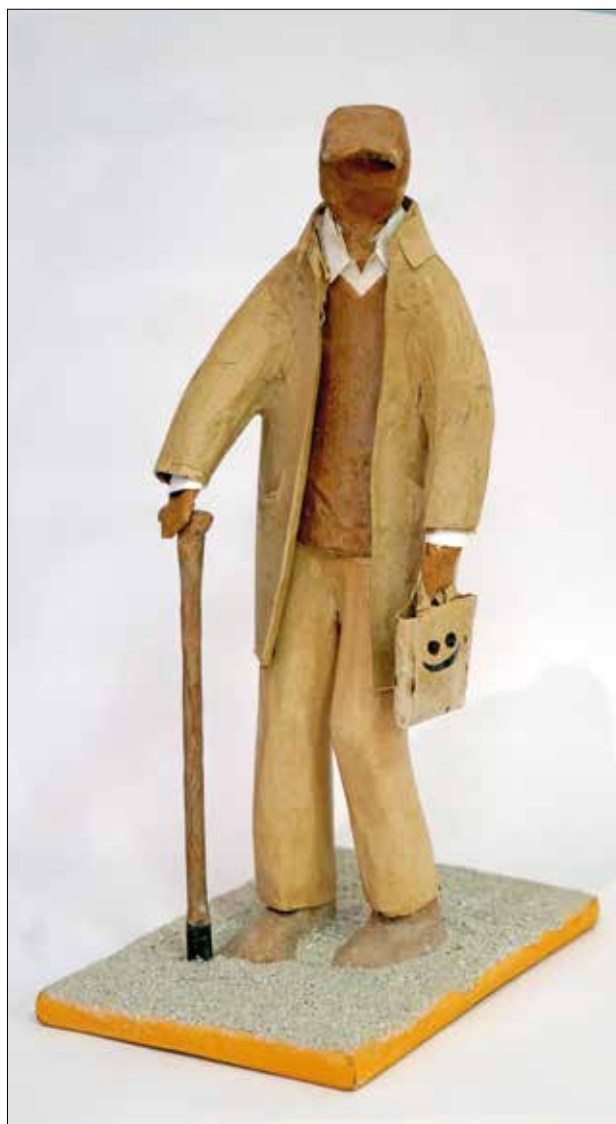
Starost, 2017., kaširani papir, 25 x 18 x 40 cm