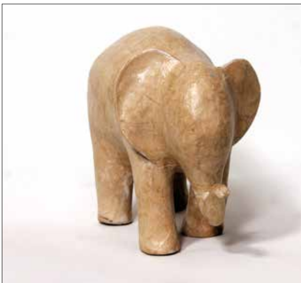
Slonić, 2017., kaširani papir, 23 x 10 x 15 cm