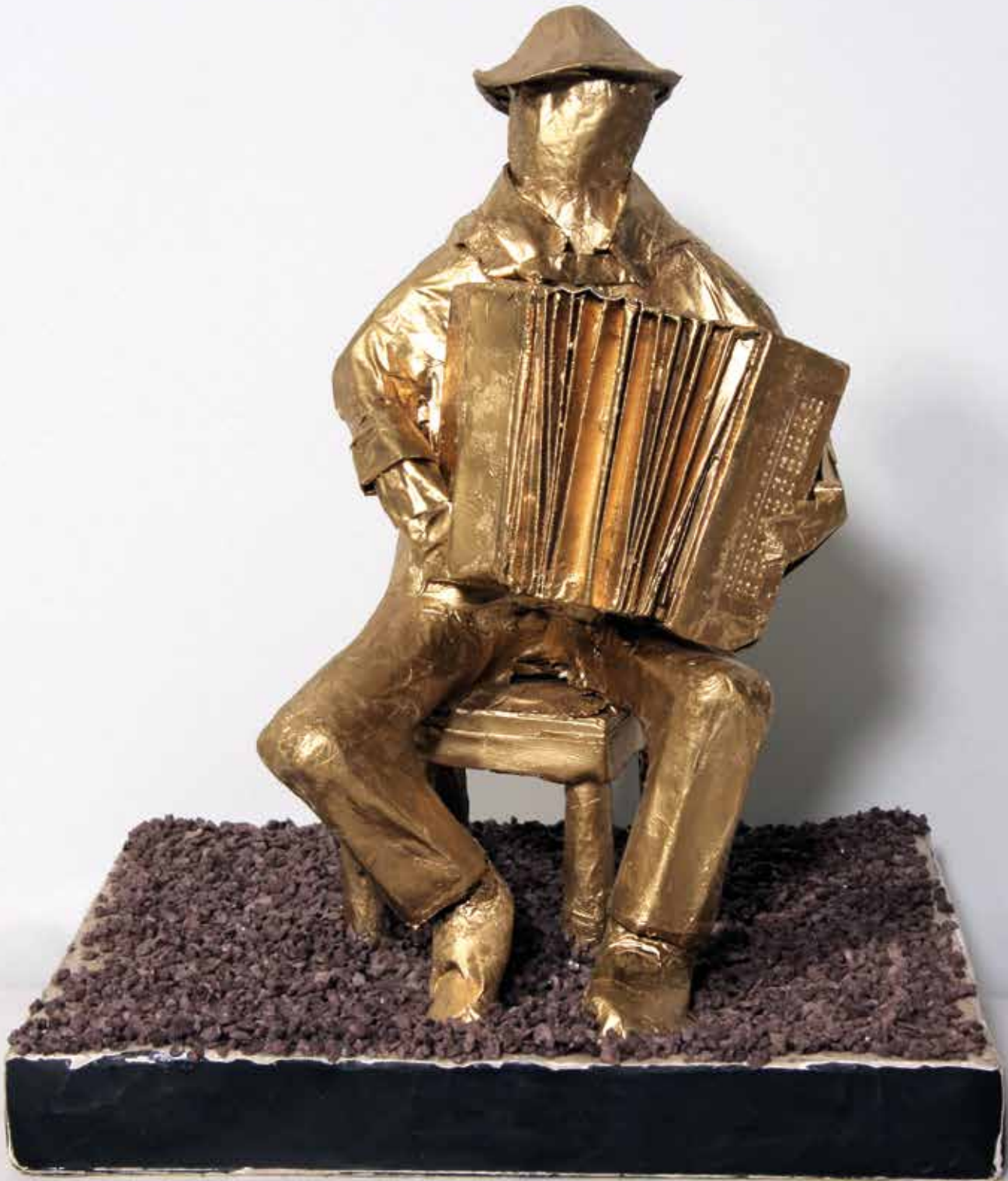
Harmonikaš, 2016., kaširani papir, 25 x 28 x 38 cm

Galerija Juraj Klović Rijeka Verdivjeva 19b 1. - 15. 10. 2024.