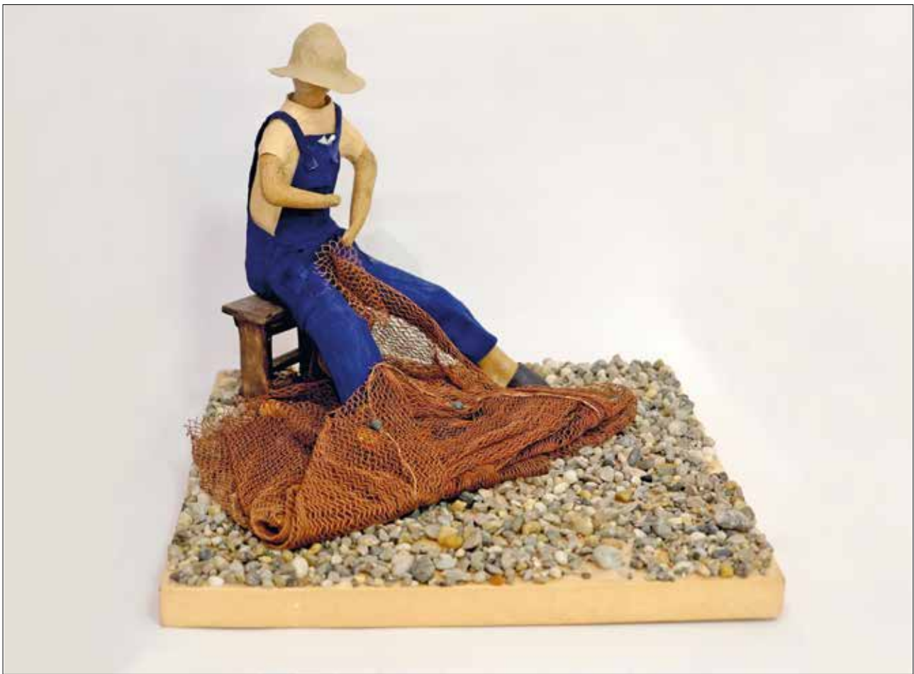
Ribar, 2018., kaširani papir, 2018., 42 x 42 x 45 cm