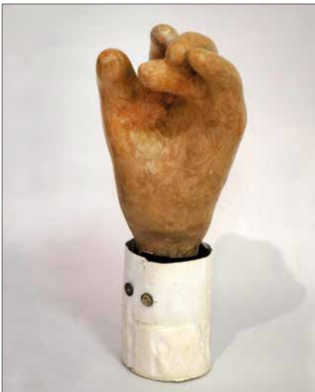
Ruka (Finta), 2017., kaširani papir, 20 x 20 x 30 cm