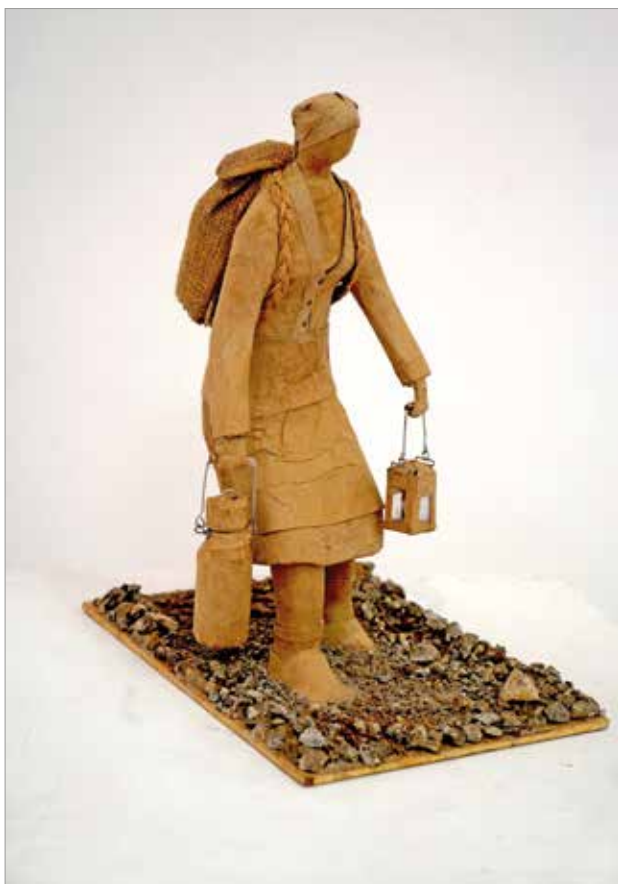
Mlikarica , 2020., kaširani papir, 35 x 24 x 42 cm