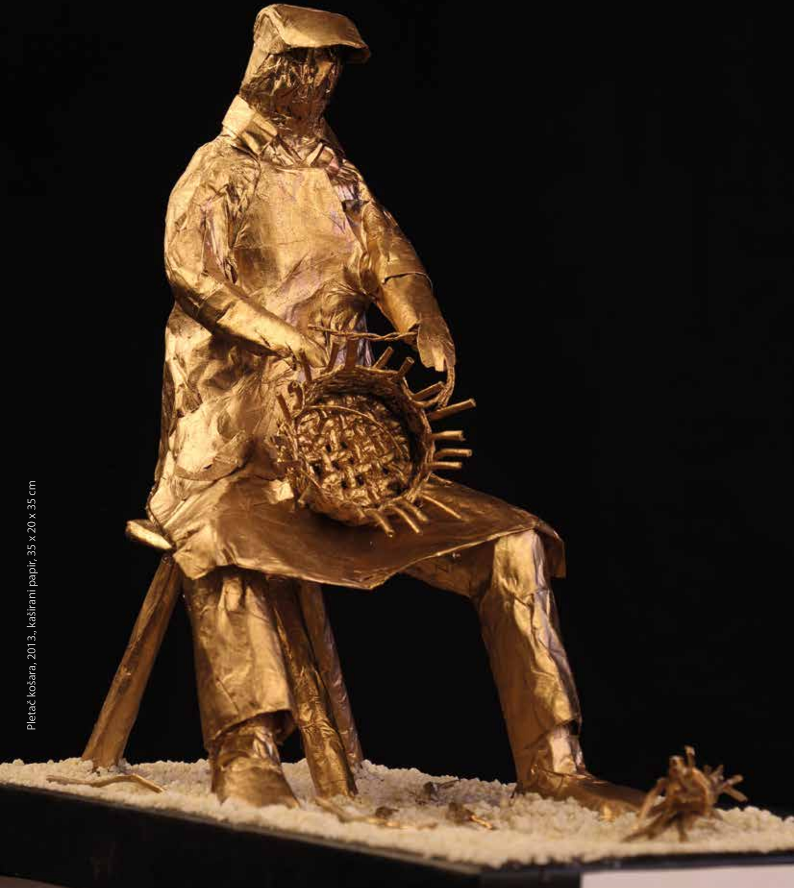
Pletač košara, 2013., kaširani papir, 35 x 20 x 35 cm