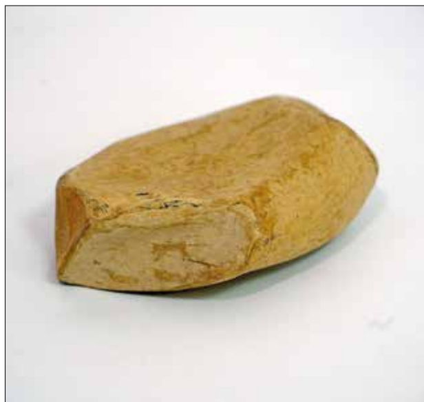
Kamen, 2019., kaširani papir, 15 x 12 x 5 cm

Emil Mandarić rođen je 1965. u Slavonskom Brodu. Oženjen je i otac dviju kćeri. Od 1970. živi u Rijeci, gdje je 26 godina radio u Ini kao industrijski tehnolog. Slijepom osobom proglašen je 2004., a iste godine postao je i članom Udruge slijepih Primorsko-goranske županije.