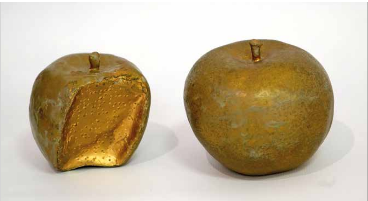
Brailleov zagriz, 2019., kaširani papir, 8 x 7 x 9 cm