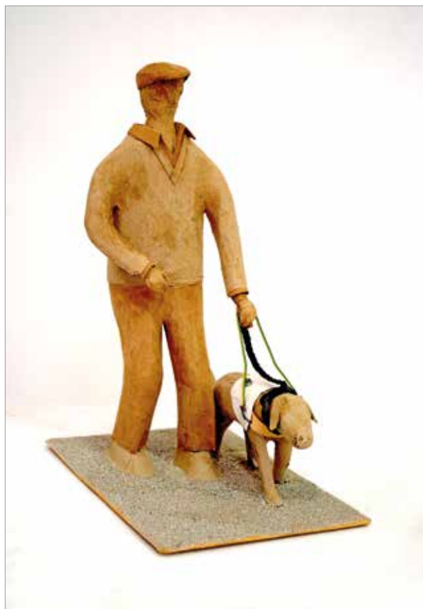
Sa psom vodičem, 2019., kaširani papir, 35 x 24 x 45 cm