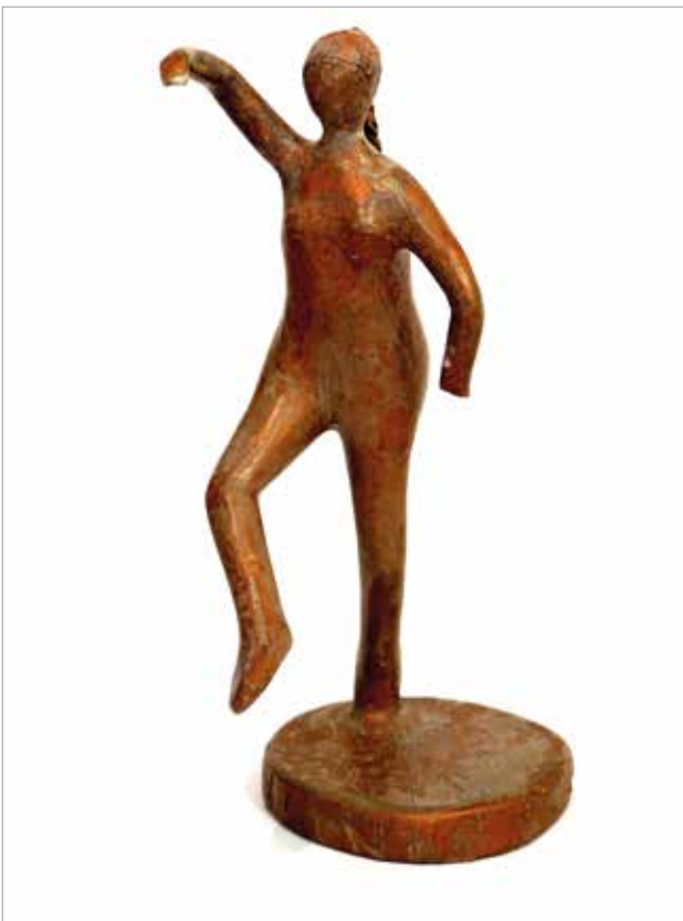
Plesačica, 2019., kaširani papir, 20 x 20 x 40 cm