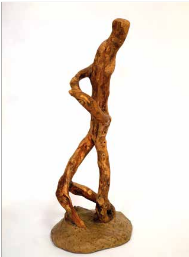
Čovjek od bršljana, 2016., kaširani papir, 20 x 15 x 50 cm