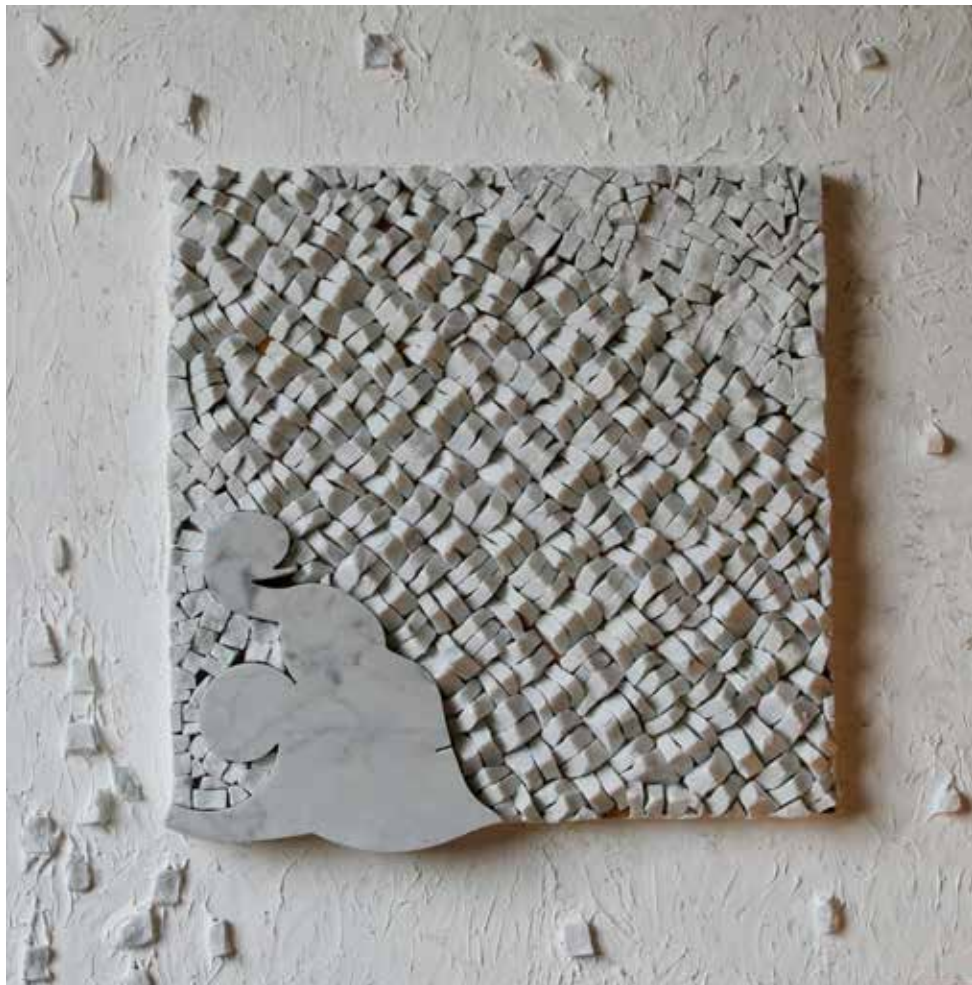
Buna zlatara Dimitrija, 2019., kombinovana tehnika, 62x62cm