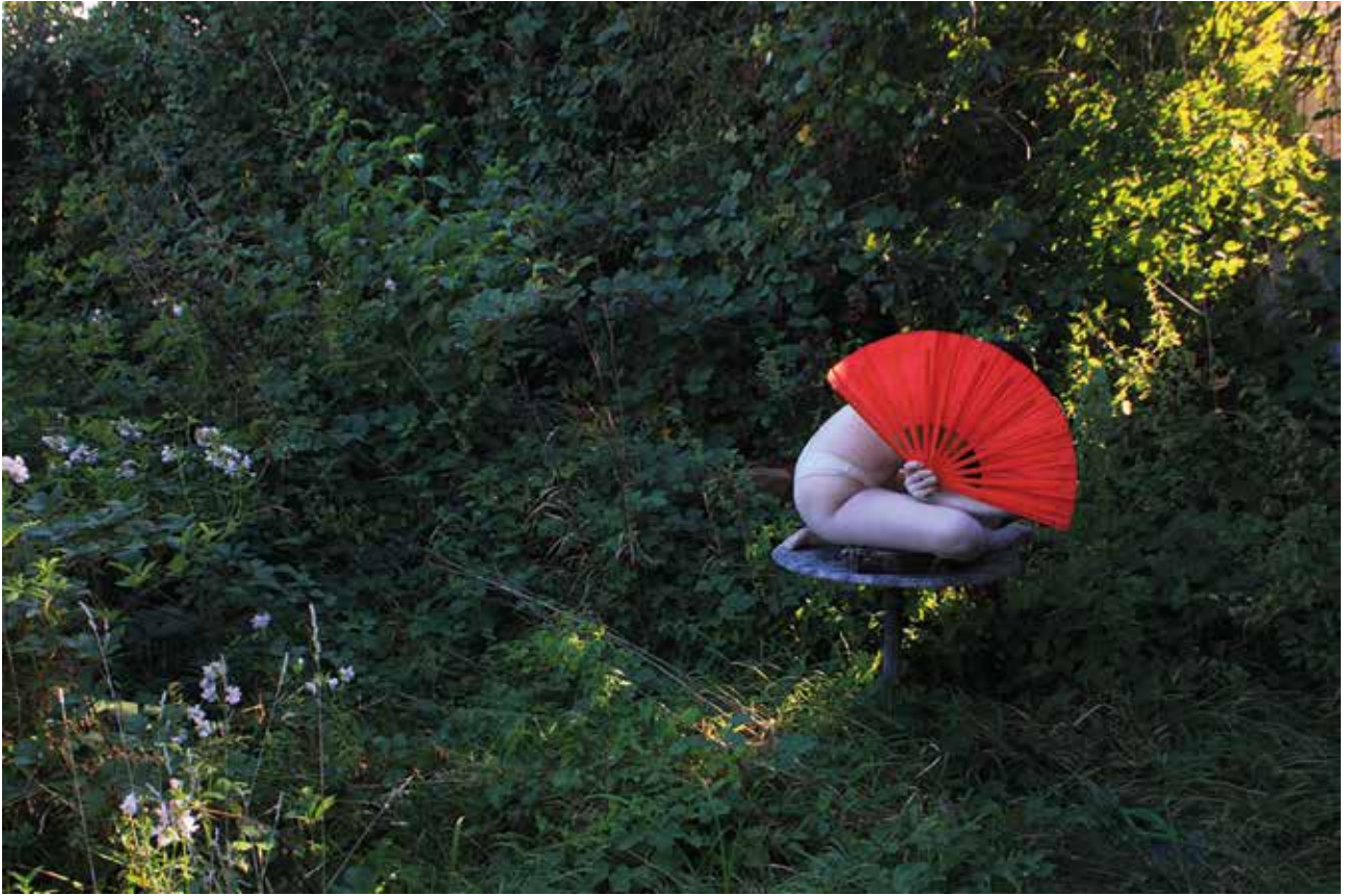
Ivana Butković, iz ciklusa Spomenik vječnom sukobu , 2023.