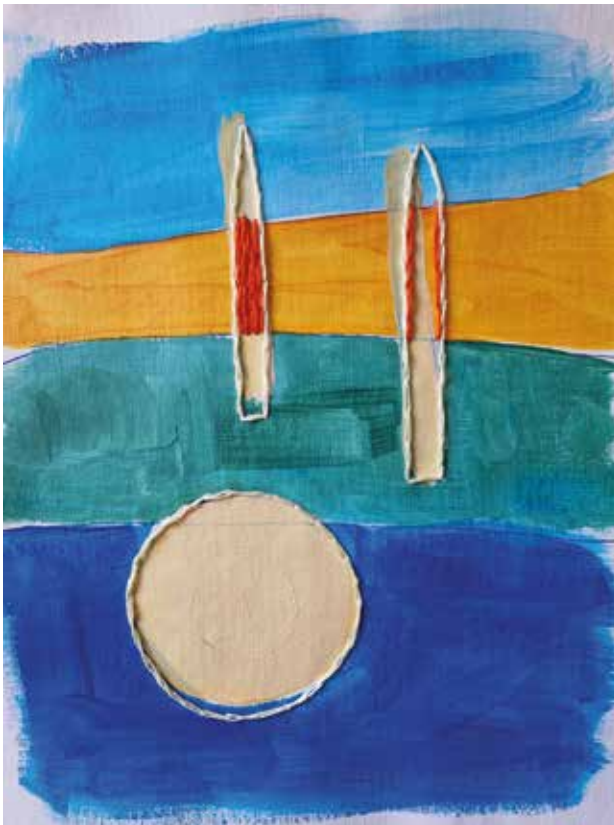
Kafić na kraju svijeta , kombinirana tehnika: akril na platnu, učni vez koncem, 25x30 cm, 2023.