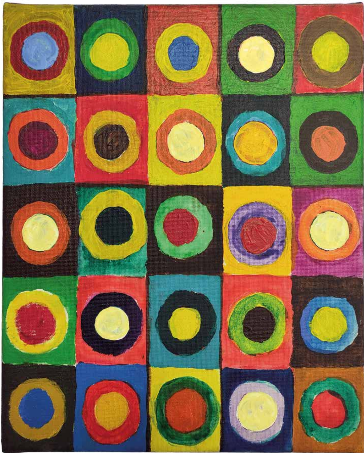
Tajna križa, 2020., akril na platnu, 300x240 mm