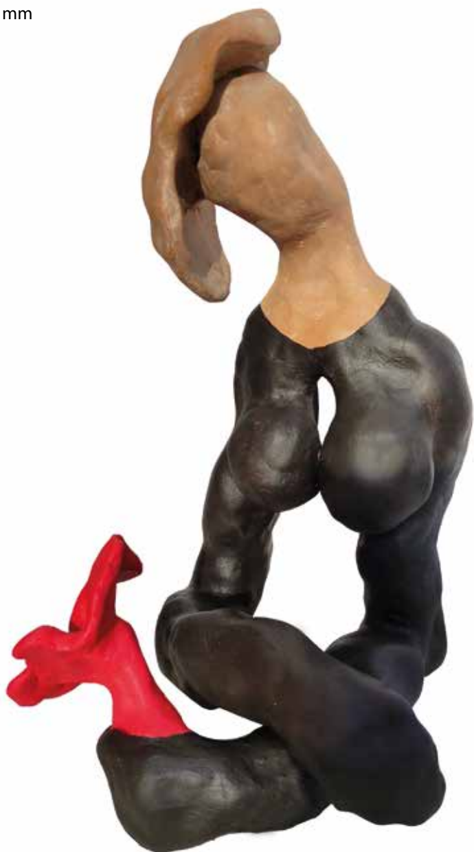
Čekajući ljubav , bojena terakota, akril, visina 23 cm

Aktualna izložba slika i skulptura, 21. „djelomično je i retrospektivna!“