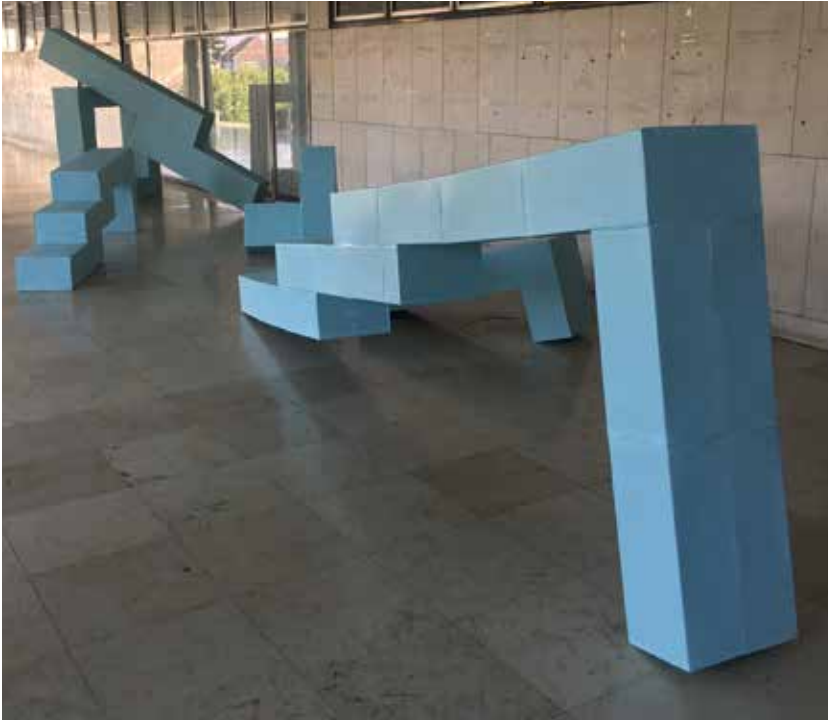
CROATIA 30 , polivalentna skulpturalna instalacija povodom 30 godina Međunarodnog priznanja Republike Hrvatske, nalazi se ispred ulaza u Pučko otvoreno učilište Zagreb, Vukovarska ulica 68.