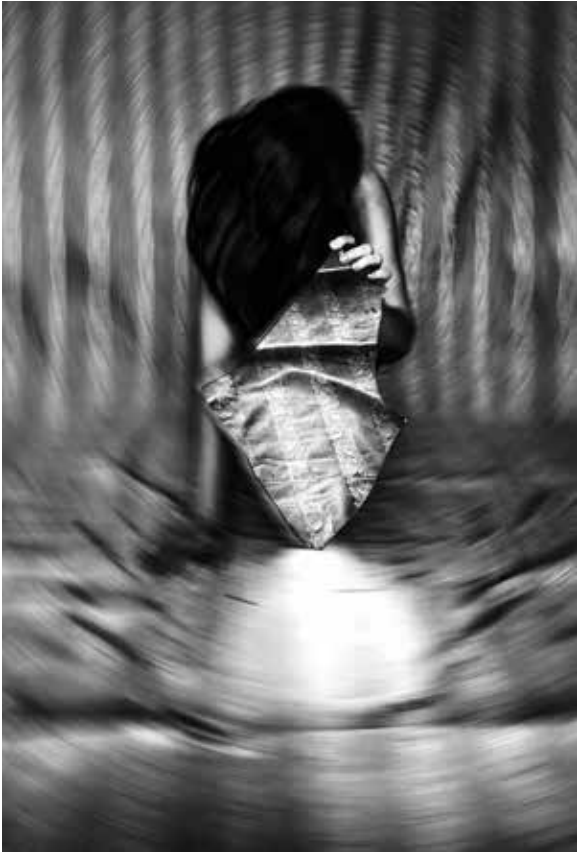
Broken Mirrors No 2, 2021. , fotografija, 75 x 50 cm