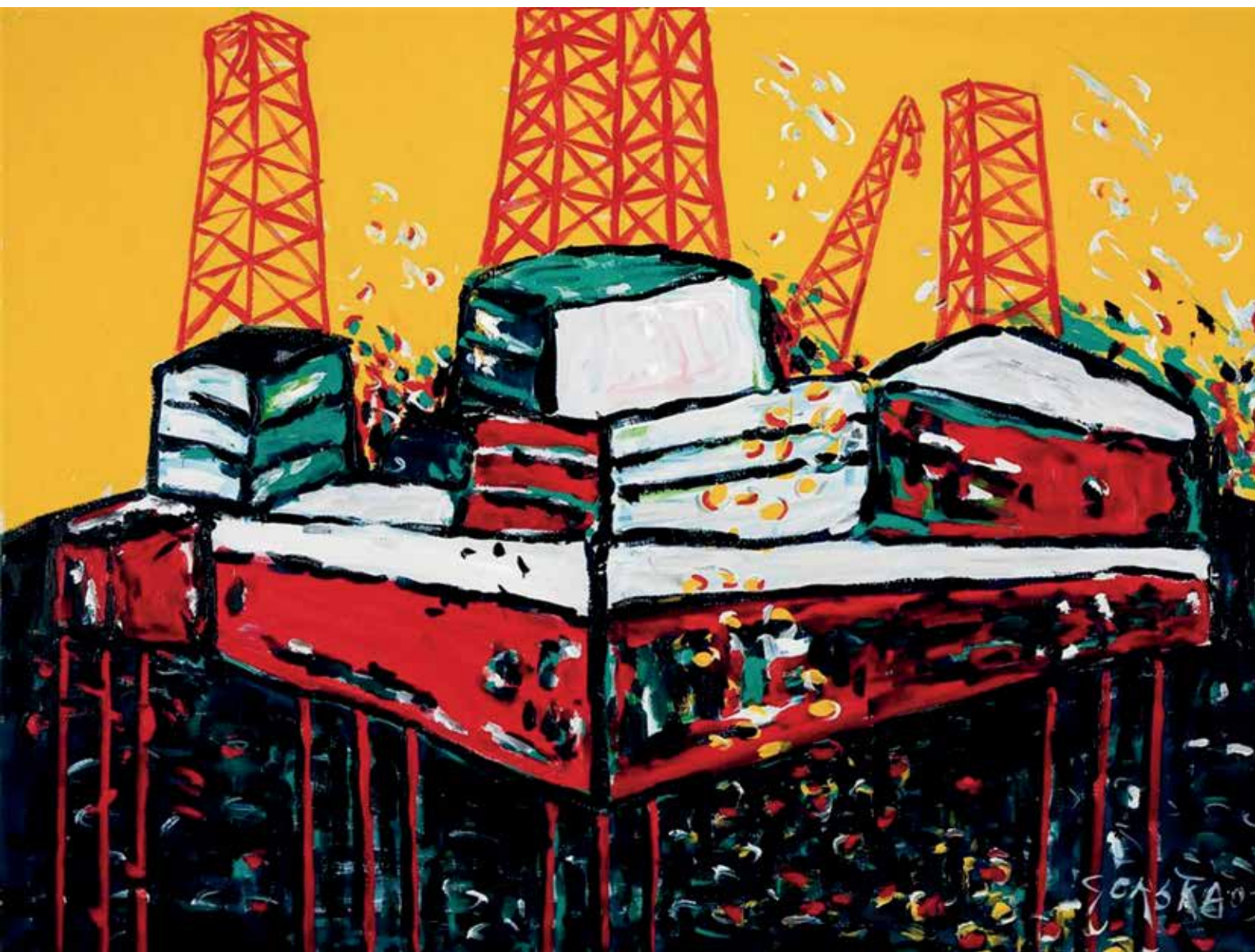
Platforma, akril na platnu, 140 x 190 cm