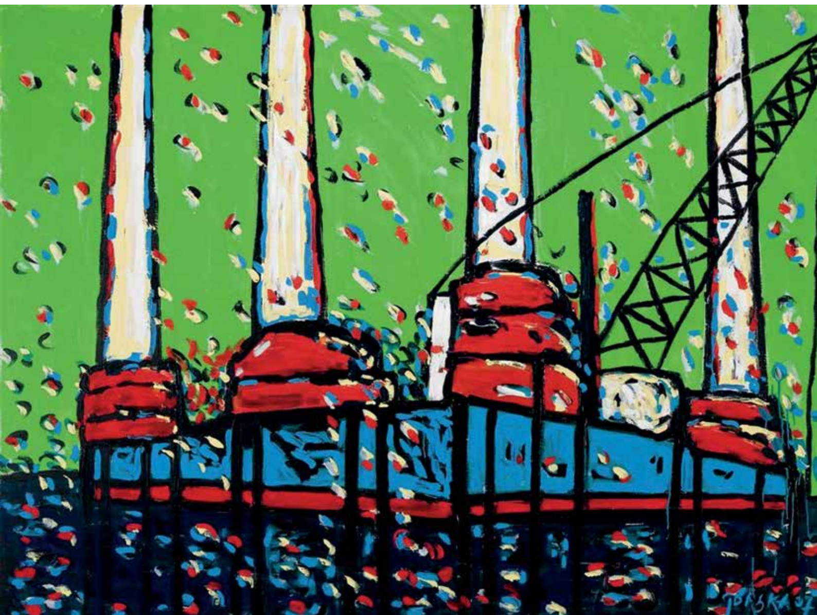
Platforma I, akril na platnu, 140 x 190 cm