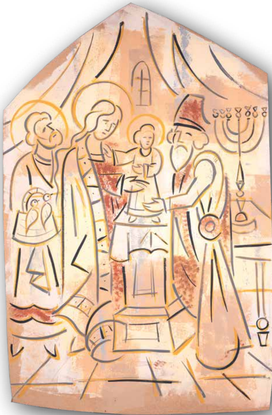
Prikazanje Gospodinovo u Hramu• Akrilik na mediapanu, 166x108 cm., 2021.