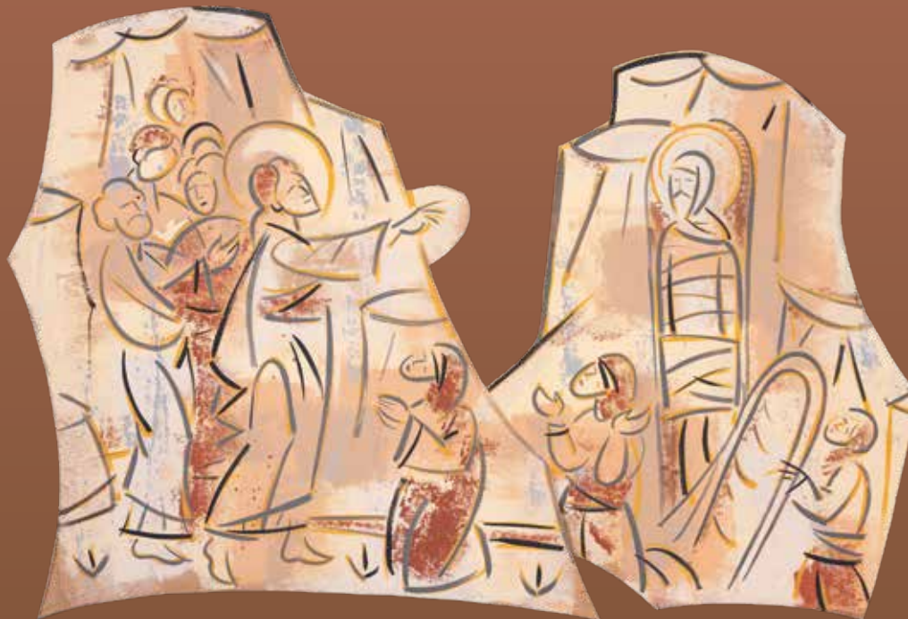
Isus uskrisuje Lazara. • Akrilik na mediapanu, 175x 98cm., 2021.