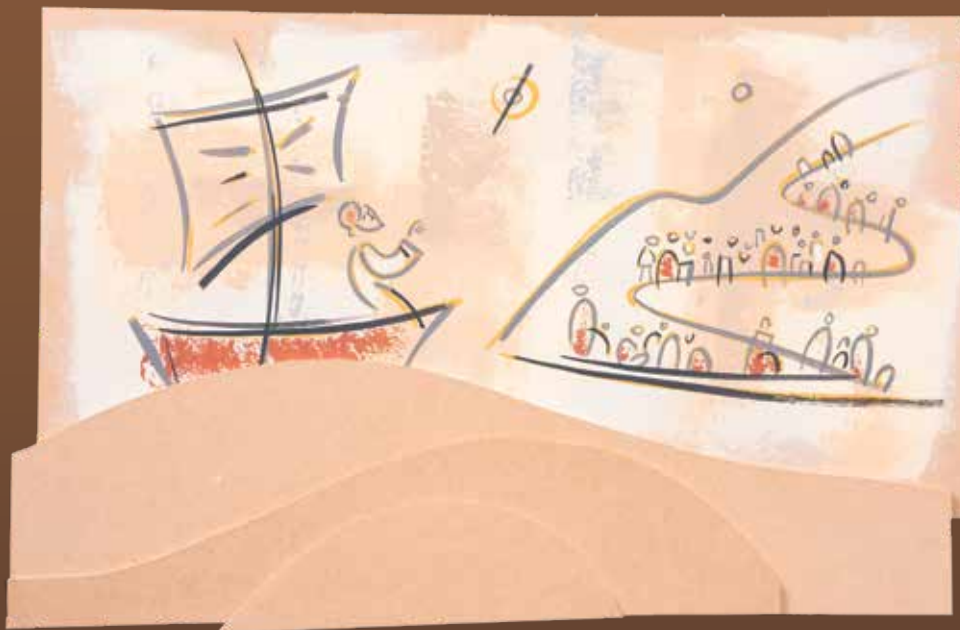
Isus iz lađe propovijeda mnoštvu u prisposodobama • Akrilik na mediapanu, 94x61 cm., 2021.