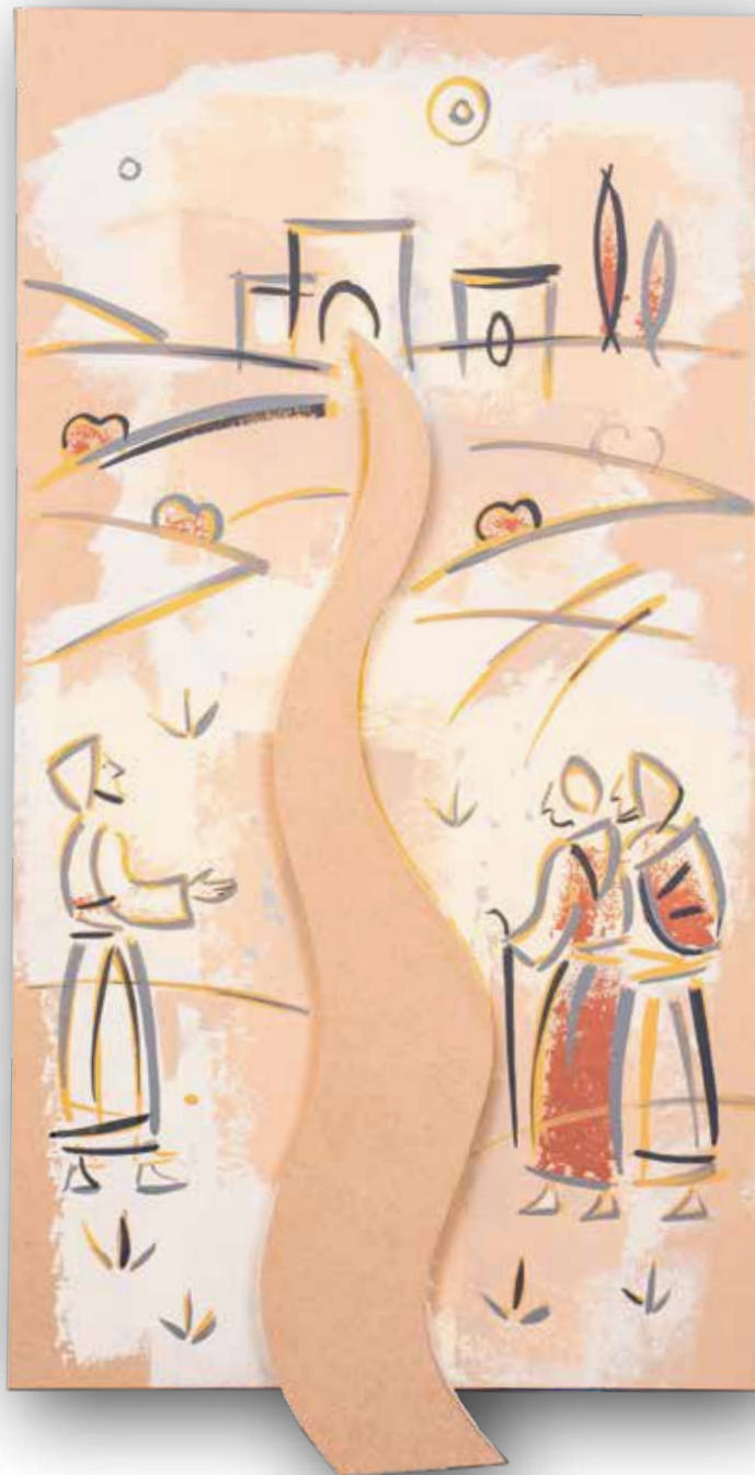
Put u Emaus • Akrilik na mediapanu, 166x108 cm., 2021.

Izložba je realizirana sredstvima: Odjela gradske uprave za kulturu Grada Rijeke Ministarstva kulture Republike Hrvatske Županije primorsko-goranske