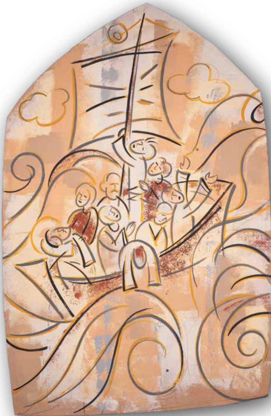
Oluja na Galilejskom moru • Akrilik na mediapanu, 166x108 cm., 2021.