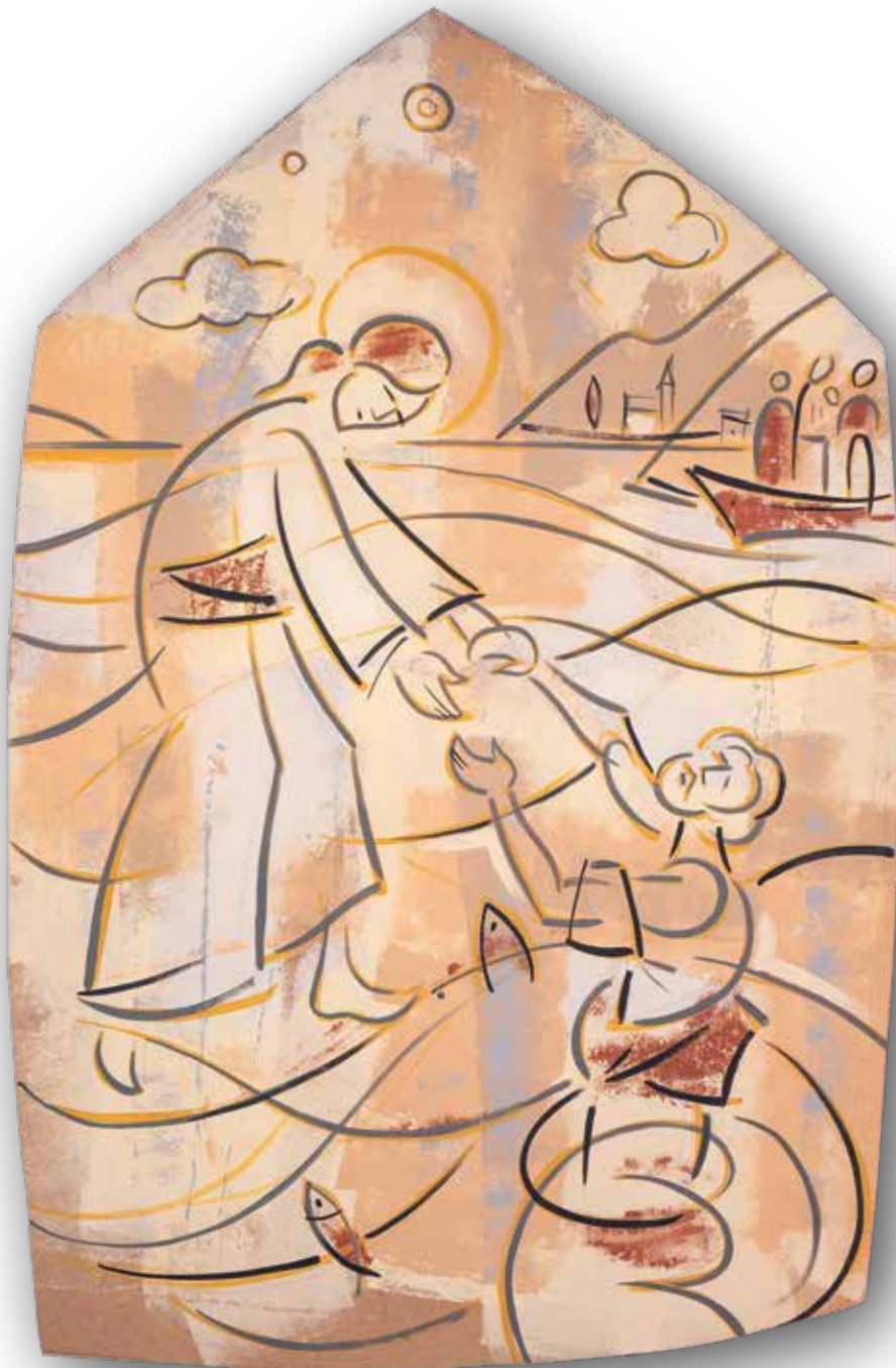
Isus spašava Petra • Akrilik na mediapanu, 166x108 cm., 2021.