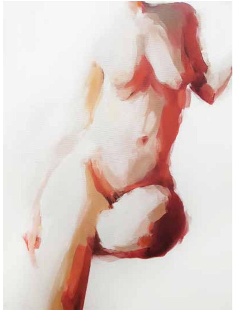
Andrea Kršul Živa , 2019., ulje na platnu, 60 x 80 cm