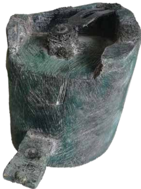
Želimir Hladnik Spartakusov oltar 3 , 2018., drvo, visina 13,5 cm