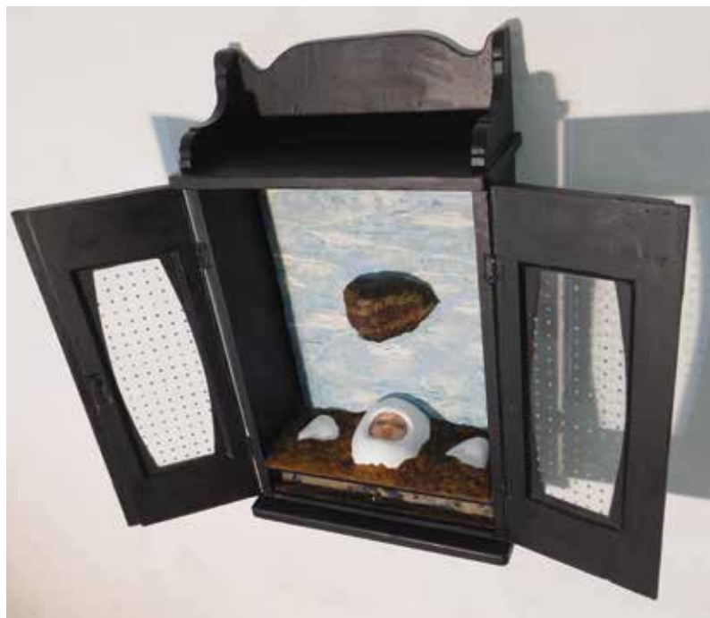
Zdravko Milić Cydoniadrón , 2018., kombinirana tehnika,