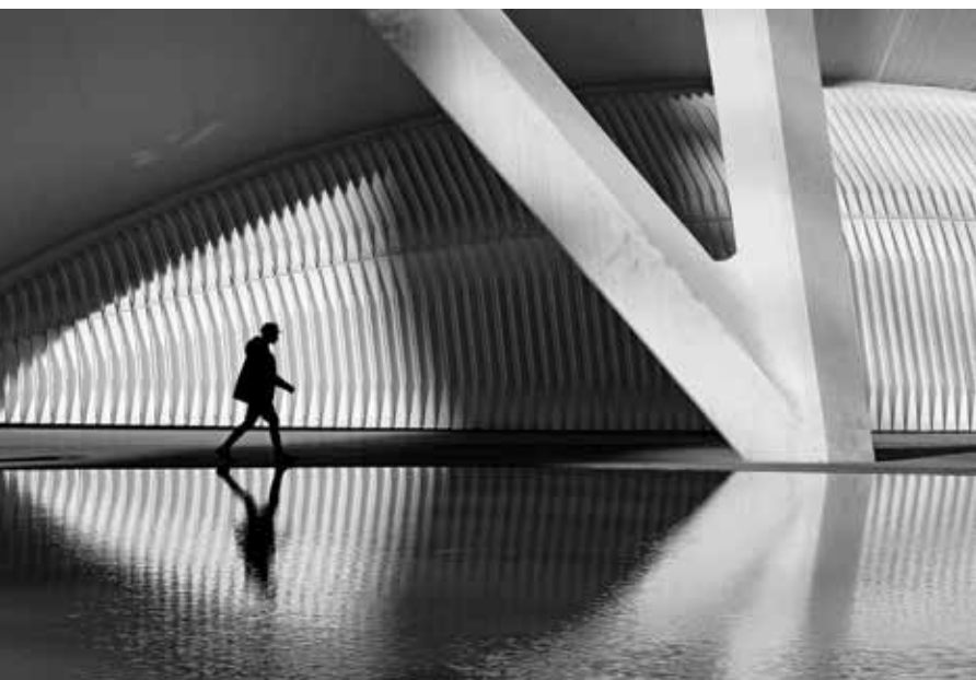
Aleksandar Tomulić Step 6 , 2018., crno-bijela fotografija, 30 x 45 cm