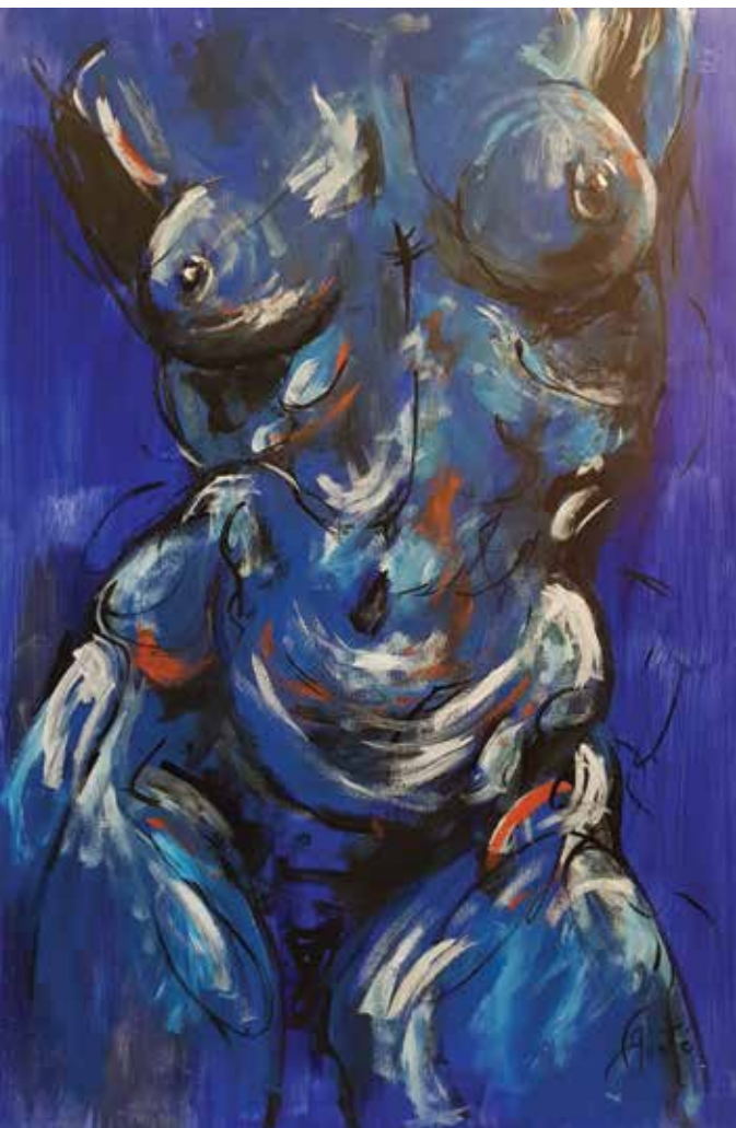
Georgette Yvette Ponté Rapsodija u plavom 1 , 2018., akril na platnu, 70 x 100 cm