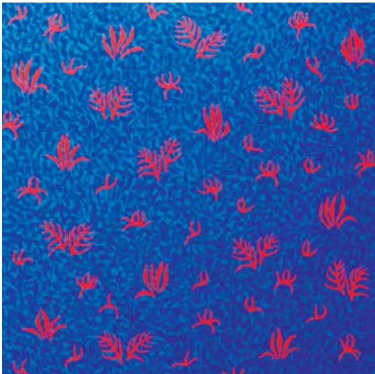
Miljenka Šepić Igra boje, livada , 2012., akril na platnu, 100 x 100 cm