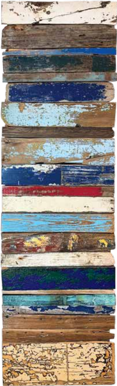
Branko Lenić Nevidljivi Horizonti , 2018., assamblage, 176 x 52 cm