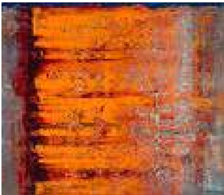
Hari Ivančić Zemlje , 2015. ulje na platnu, 100 x 116 cm